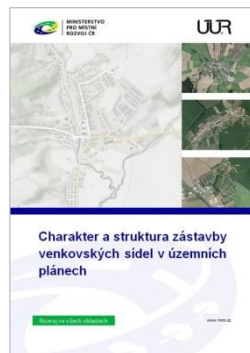
Ukázky výstupů ÚÚR v rámci implementace