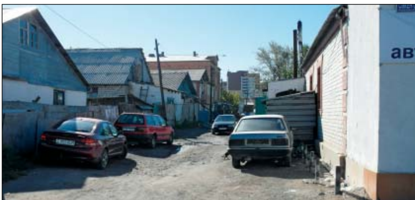
Shluk domů v předměstí. V pozadí se již objevuje nová výstavba.

sející malé parcely jsou řazeny kolem úzkých, nezpevněných (nebo částečně zpevněných) ulic. Nevím, jak se na jedné z nich vedle sebe užíví pět kameno-sochařství nebo přibližně stejný počet opraven automobilů. A je tu živěji než v centru. Je tu také největší astanská tržnice. I tato městská část postupně ustupuje Novému městu. Možná je to škoda. Vybrali jsme si ji ale pro urbanistický workshop, který jsem v Astaně s místními studenty architektury uspořádal.