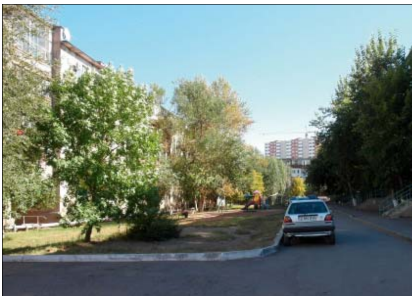
Socialistické sídliště z 60. let 20. století. V pozadí z něj ukrajuje nová vysokopodlažní zástavba.

téká řeka Išim. Nové město tuto řeku nedávno překročilo a kobercovým způsobem postupně likviduje neutěšenou minulost, aby ji nahradilo, v duchu tezí prezidenta, zářivější budoucností.