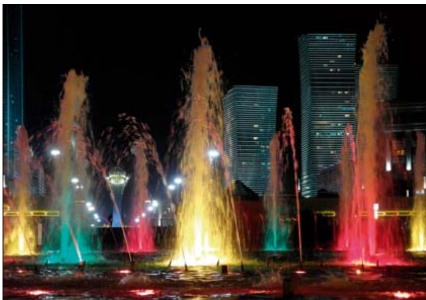
Centrální promenáda večer

Республики Казахстан [online]. [cit. 2013-07-16]. Dostupné z: http://gask.kds.gov.kz/ .