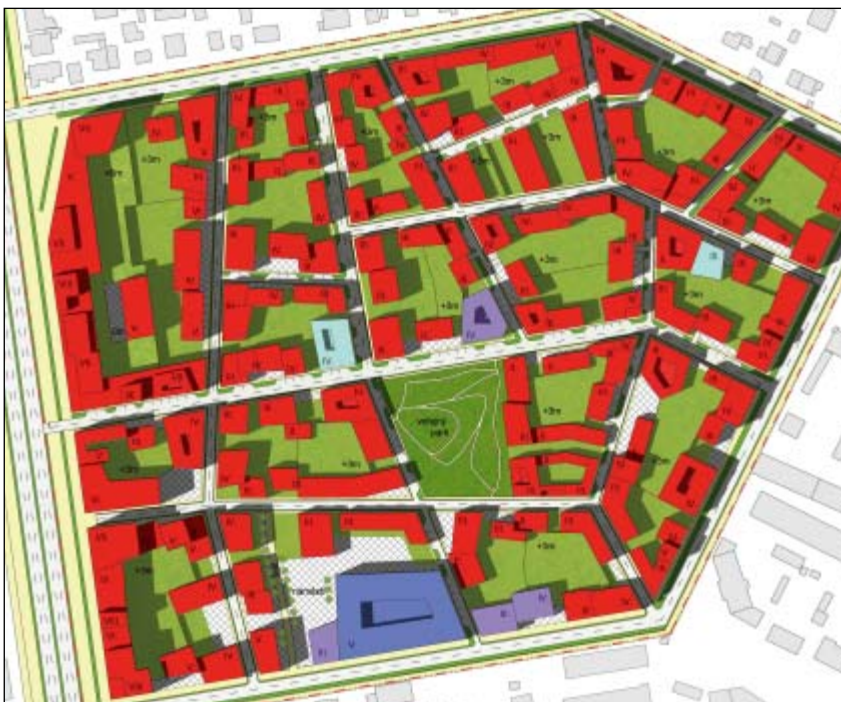
K. Hegrová: Návrh přestavby předměstského území v Astaně, ateliérová práce 2012/2013. Záměrem bylo nabídnout příjemnější měřítko.