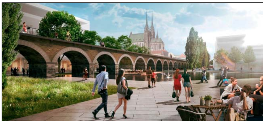
Vizualizace viaduktu z územní studie „Budoucnost centra města Brna ve variantě přestavby ŽUB Řeka“, Sdružení Koleček – Jura, architekti Lausanne – Brno

Budoucí městská čtvrť Bubny-Zátory má finální podobu. Územní studie, ke které se občané vyjadřovali loni v létě, je aktualizována dle připomínek. Mezi nejzásadnější změny ve studii oproti předchozímu návrhu patří snížení výškové hladiny v některých částech čtvrti, větší důraz na zeleň a obecně větší respekt k památkám. Souběžně s pořízením územní studie probíhá i změna územního plánu, která byla schválena v říjnu 2020. Veřejné projednání návrhu změny územního plánu se odehraje zhruba za rok. Ovšem již nyní mají vlastníci možnost projektovat podle finální verze studie.