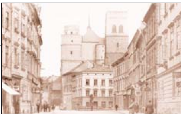
Foto 1a: Olomouc – zástavba kolem chrámu sv. Mořice, na tomto místě později vyrostl obchodní dům PRIOR, ul. 8. května (rok 1910)