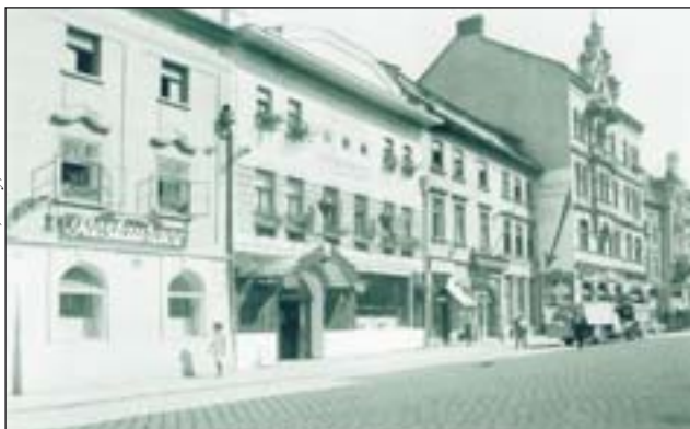
Foto 2a: Olomouc – ul. Pekařská, na místě hotelu Přerov vyrostl později obchodní dům Koruna (rok 1930)