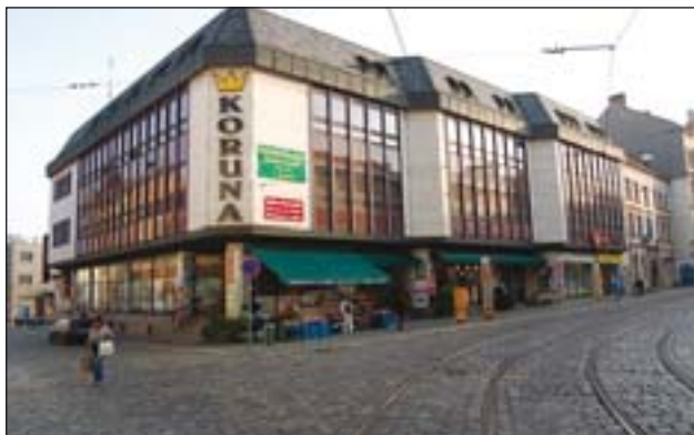
Foto 2b: Olomouc – obchodní dům KORUNA na ul. Pekařské (rok 2006)