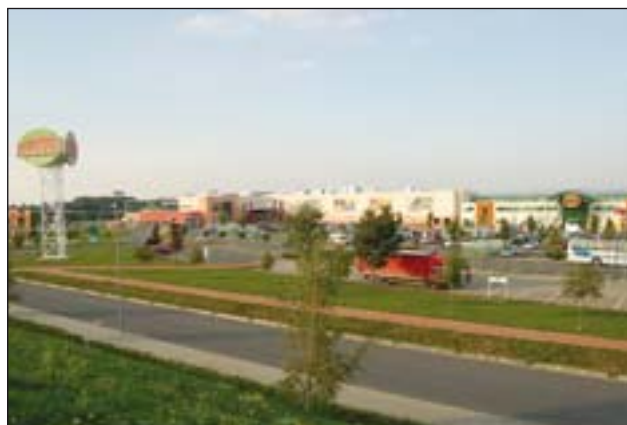
Foto 6: Nákupní centrum Olomouc City v severozápadní okrajové části města Olomouce (exit Mohelnice-Praha)