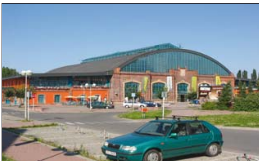
Foto 4: Olomouc – obchodní dům SENIMO, industriální architektura objektu dřívě fungujícího jako městská jatka (revitalizace v roce 1993)

S rozvojem moderních nákupních center došlo nejen v Olomouci, ale i v řadě dalších měst České republiky k zásadnímu obratu v dojížděcí obyvatelstva za nákupy. Na rozdíl od předchozích let, kdy se nákupní cesty soustřeďovaly do center měst, se situace během velice krátké doby změnila. Lidé rychle přijali nový model obchodního urbanismu, kde doprava autem za nákupy je pro ně daleko výhodnějším řešením nežli nakupování v centru města. A tak ani nepřekvapí rozložení nákupních center a hypermarketů poblíž důležitých dopravních tras, často na městské periferii, jak ukazuje obr. 1. Ve výsledku se tak klasické obchodní domy, jejichž existence je založena především na pěší dopravě, dostaly do pozice takřka druhořadých nákupních cílů, podobně jako mnohé kamenné obchody v centru města.