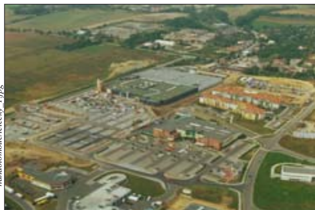
Foto 5: Olomouc – komplex velkoobchodních prodejen v suburbánní lokalitě Horní lán, kde dominuje nákupní centrum OC Haná

PTÁČEK, P. Changes in socio-spatial structure in Olomouc, Czech Republic during the transformation period after