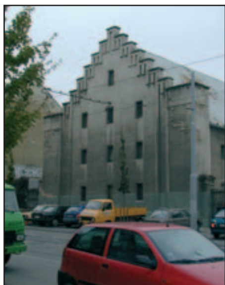
Veveří Brno – sklady.