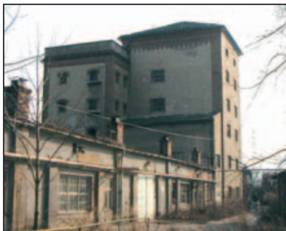
Sladovna Briess – současný stav.