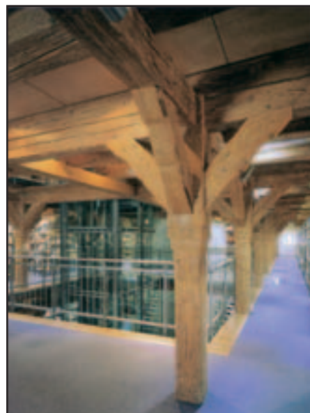
Biberach – interiér knihovny.