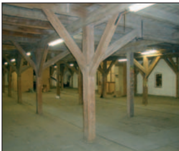
Veveří Brno – interiér.