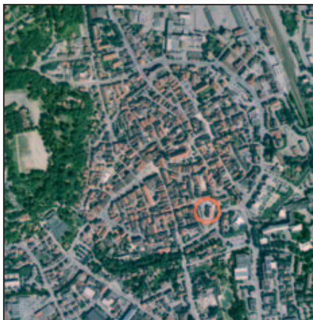
Biberach – letecký snímek, umístění bývalé sýpky.