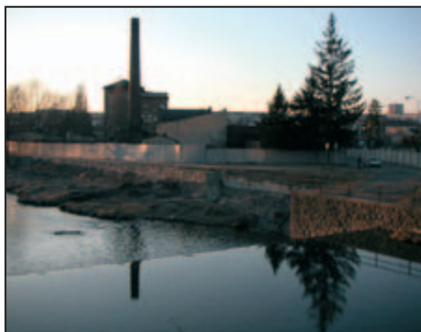
Sladovna Briess – svitavské nábřeží v Brně.

najímající jej různým subjektům, mj. i obchodnímu řetězci Julius Meinl. Přes