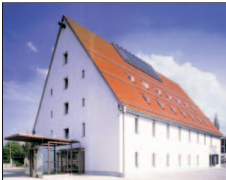
Biberach – rekonstruovaná budova knihovny.

Po technické stránce byl průběh rekonstrukce rovněž velmi zajímavý. Rekonstruovaný dům má šest pater. Narušená konstrukce základů byla zajištěna a ostatní prvky v nejnětější míře nahrazeny (střešní trámy, sloupy, krokve a pozednice). Po odstrojení staré střešní krytiny a odejmutí vnitřních nenosných stěn a stropů byla celá vnitřní konstrukce hydraulickým zvedákem vyzdvížena o 10 – 12 cm. Tím bylo dosaženo vyrovnání nepříznivého průhybu