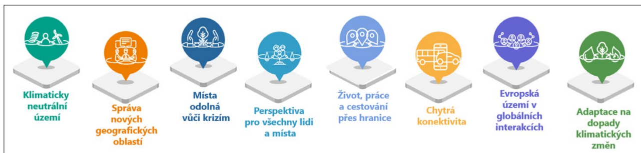
Tematické akční plány