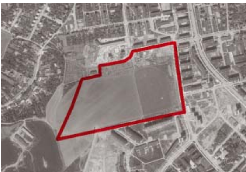
Letecký snímek území z roku 1971

ce – škrabku na trus, která odstranila veškeré nečistoty do výlevky na konci jednotlivých řad • krmící korytka, která objížděla v určitou hodinu klece, ve kterých slepice žily a ony musely v tomto daném okamžiku uzobnout svůj jedoucí oběd • vajíčko, které snesly se vykutálelo ven z mřížky do přichytného zásobníku, kde přicházel člověk moderní doby, vajíčko sebral a uložil je do kartónu k dalším, již dříve sebraným •