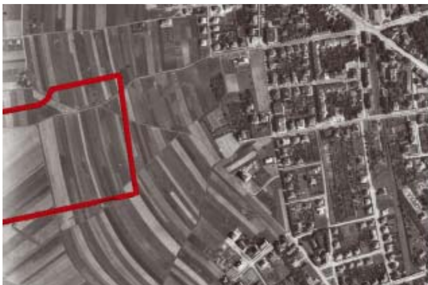
Letecký snímek území z roku 1938