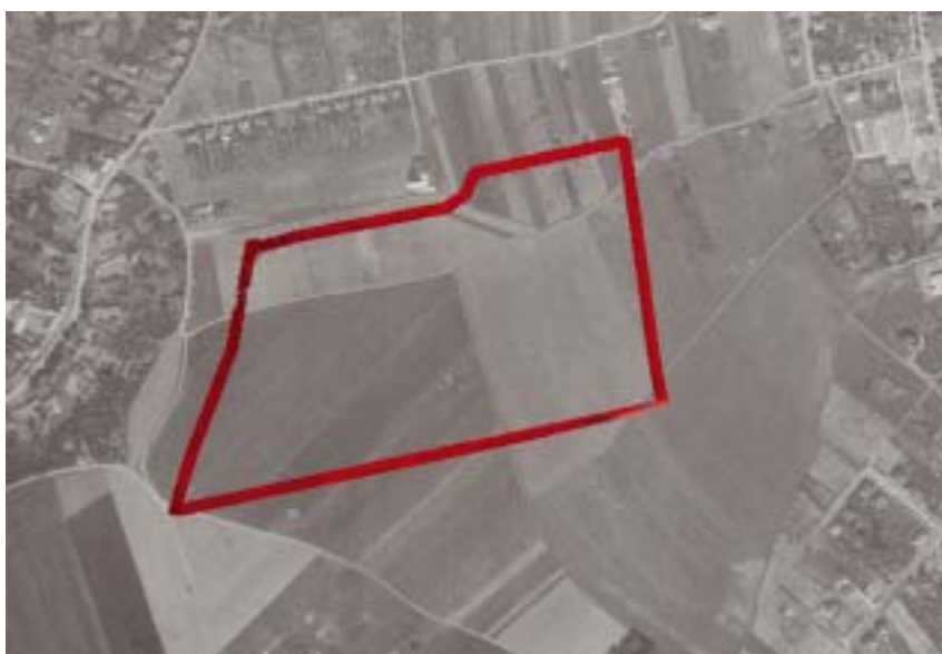
Letecký snímek území z roku 1954