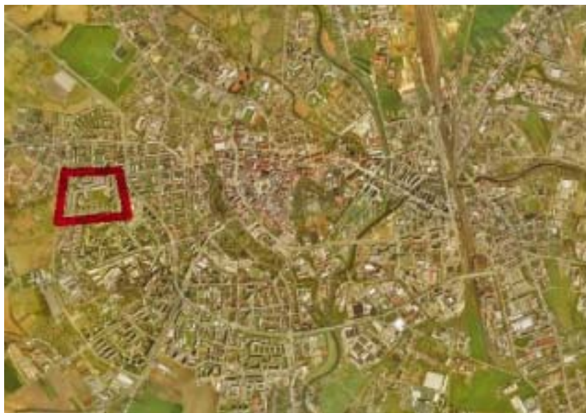
Poloha sídliště na leteckém snímku