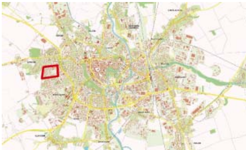
Poloha sídliště v rámci města

zovatelnosti jednotlivých navrhovaných opatření. Město od začátku spolupracovalo s Ústavem územního rozvoje v Brně, které je konzultačním střediskem MMR ČR v oblasti regenerací panelových sídlišť. Pro pilotní program regenerace byla nakonec vybrána lokalita v západní části města sídliště „Úzké Díly“ v městské části Neředín o rozloze cca 15 ha. Lokalita leží v území, které bylo řešeno Územním plánem sídelního útvaru Olomouc, schváleným zastupitelstvem města v roce 1998.