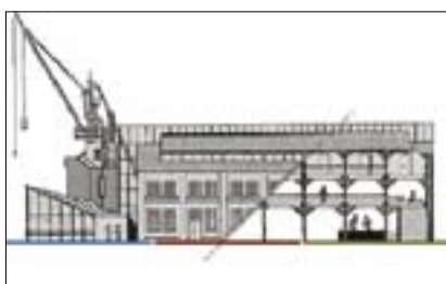
Fabrik Hamburg – Řez-pohled