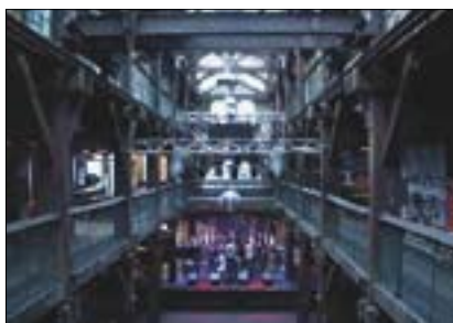
Fabrik Hamburg – Interiér