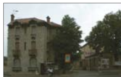
Fabrik-théâtre – Vstup z boulevardu Limbert