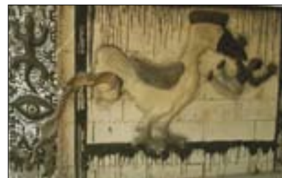
Fabrik-théâtre – Exteriérová plastika

Avignonský příklad však zdaleka není osamocený. V německé Postupimi využili staré tovární strojírenské haly k založení tanečního divadla. V roce 1990 zde vzniká veřejně pro-