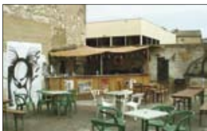
Fabrik-théâtre – Divadelní „zahrada“

spěšný divadelní spolek podporující tanečníky. Během dvaceti let „Fabrik Potsdam“ vypsela k uznávanému divadlu moderního tance a sídla mezinárodní taneční společnosti. Stěžejní umělecká činnost tkví v propojení moderních výrazových tanců, majících kořeny v národních tradicích, s jinými uměleckými prostředky, stále častěji multimediálního charakteru. Každoročně divadlo pořádá Mezinárodní postupimské dny – festival soudobého tance za účasti předních světových choreografů a tanečních skupin. Součástí divadla je i zvukové studio, podporující zejména začínající mladé muzikanty. Při návštěvě Postupimi najdeme tuto divadelní scénu na Schieffbauergasse 1.