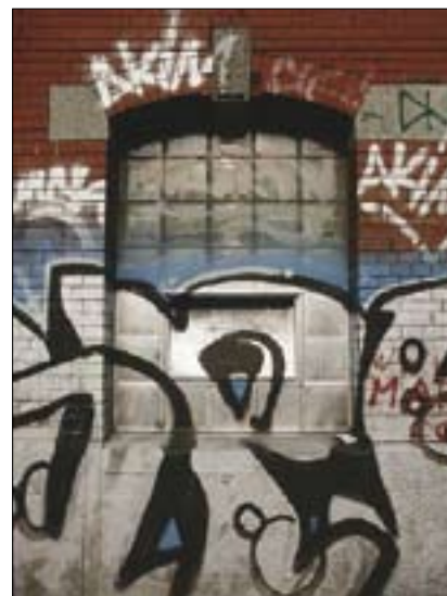
Roten Fabrik – Grafitti

lecký ateliér. Mezi léty 1977–1980 hrozí kulturnímu centru zrušení a uzavření, zájmovému společenství „Život ve smrti továrny“ se podaří prosadit záchranu projektu a od 25. října 1980 je kulturní centrum „Roten Fabrik“ opět v provozu. Rokem 1981 přechází objekt pod památkovou péči. V roce 1987 se opět potácí na existenční hraně. Curyšští měšťané nakonec poměrem dvou třetin hlasů prosazují zachování kulturního zařízení s názvem „Centrum pro volný čas, kulturu a vzdělávací aktivity“ s roční subvencí 1,975 mil. švýcarských franků. Léta 1990–1995 jsou ve znamení sanačních úprav objektů. V roce 1992 je otevřeno divadlo s klubovým prostorem, v roce 1994 přestavěna vnitřní hala a restaurace. Přestavbou haly s původní šedovou střechou a uměleckého ateliéru je v roce 1995 rekonstrukce „Červené továrny“ ukončena pořádáním festivalu, který je zároveň oslavou patnáctiletého trvání kulturního centra. Tzv. otevřený víkend „Tři dny ryzí kultury“ v roce 2000 završuje již dvacetileté působení kulturního centra „Roten Fabrik“.