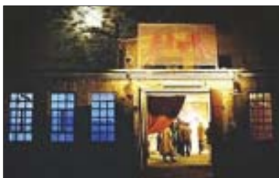
Fabrik Potsdam – Vstupní portál