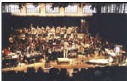
Fabrik Potsdam – Jevišťe