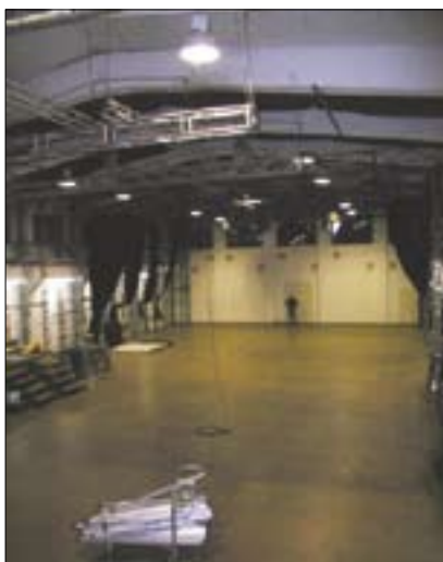
Fabrik Potsdam – Divadelní sál

„Roten Fabrik“ – „Červená továrna“ (Curych, Švýcarsko) odvozuje svůj název od své rezné cihlové fasády. Na rozdíl od předešlých zde můžeme zaznamenat působivý architektonický výraz industriální architektury konce 19. století, byť dnes poznamenaný „uměleckým“ vstupem fenoménu konce 20. století – „grafitti“.