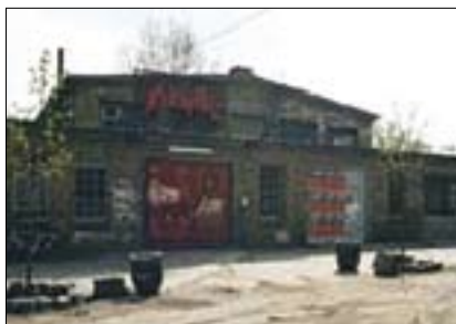
Fabrik Potsdam – Divadelní budova

spěšný divadelní spolek podporující tanečníky. Během dvaceti let „Fabrik Potsdam“ vypsela k uznávanému divadlu moderního tance a sídla mezinárodní taneční společnosti. Stěžejní umělecká činnost tkví v propojení moderních výrazových tanců, majících kořeny v národních tradicích, s jinými uměleckými prostředky, stále častěji multimediálního charakteru. Každoročně divadlo pořádá Mezinárodní postupimské dny – festival soudobého tance za účasti předních světových choreografů a tanečních skupin. Součástí divadla je i zvukové studio, podporující zejména začínající mladé muzikanty. Při návštěvě Postupimi najdeme tuto divadelní scénu na Schieffbauergasse 1.