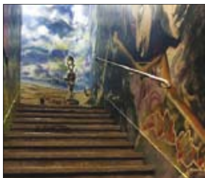
Roten Fabrik – Schodiště