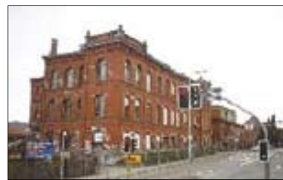
Roten Fabrik – Hlavní tovární budova