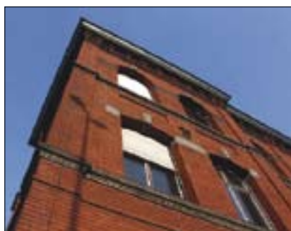
Roten Fabrik – Detail fasády