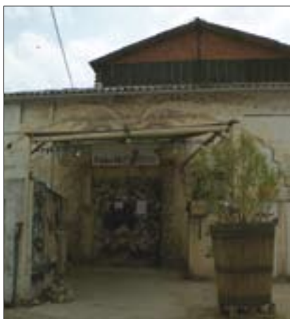
Fabrik-théâtre – Vstup