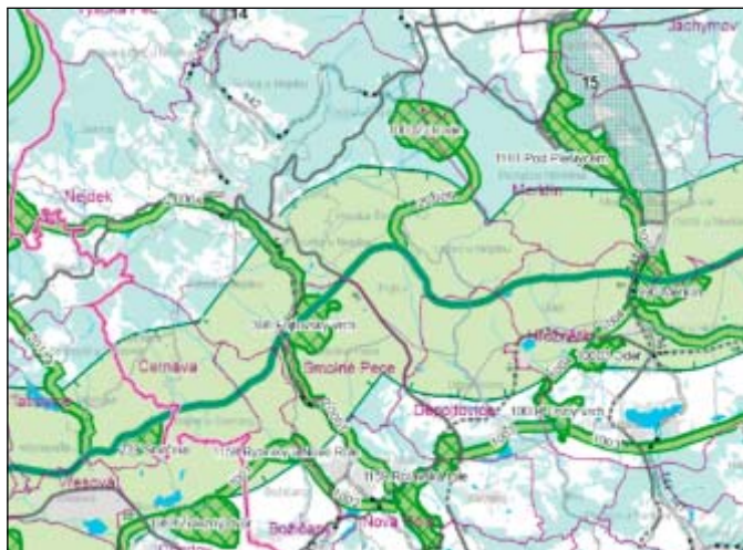
Obr. 1: Srovnatelný výřez platného Územního plánu velkého územního celku Karlovarsko-sokolovské aglomerace – hlavní výkres 1 : 50 000 (nahore) a výřez návrhu Zásad územního rozvoje Karlovarského kraje – výkres ÚSES 1 : 100 000 (dole)

grafické vyjádření mnohem blíže k formě účelově orientované „mapy“ nebo „plakátu“ než k výkresu jako součásti územně plánovací dokumentace. ZÚR v tomto pojetí vytvářejí určitý hraniční přechod mezi Politikou územního rozvoje České republiky a podrobnější územně plánovací dokumentací – jsou tedy nástrojem, který bude sloužit především průřezem nadřazených celorepublikových záměrů do krajské úrovně a jeho prostřednictvím pak i do územ-