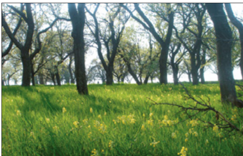
Obr. 4: Jarní poetická krása starého jabloňového sadu na slovenských Kopanicích