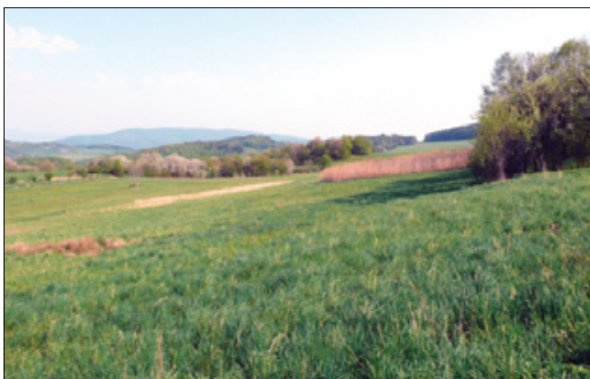
Obr. 3: Fotogenické scenérie mozaikovitě krajiny zachovalé drobné držby a rozptýleného osídlení v Bílých Karpatech