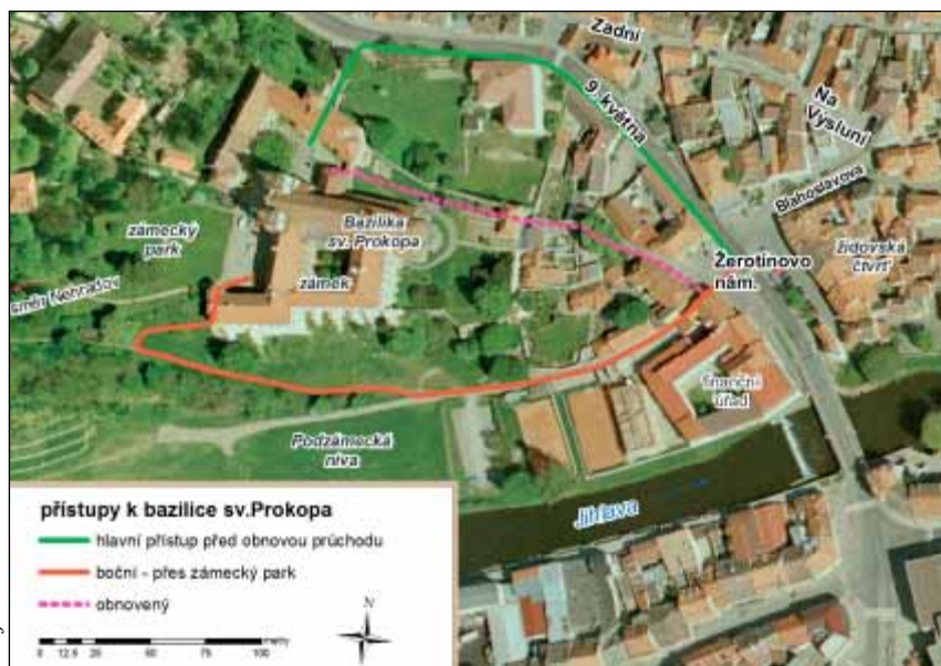
Letecký snímek zájmového území

za dnešním finančním úřadem na Žerotínově náměstí. O vhodnosti tohoto zásahu z hlediska historického a architektonického by bylo možno polemizovat, zvláště když toto spojení už není dlouhá desetiletí využíváno.