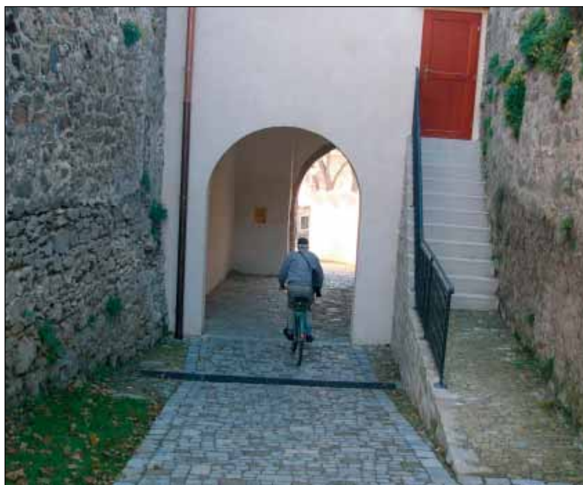
Obnovený průchod – pohled od baziliky sv. Prokopa

Stavební a průzkumné práce se časově částečně překrývaly. Teprve po odstranění mohutných vrstev zeminy a stavební suti narazila stavební firma pod bývalou obrannou věží na středověkou valounovou dlažbu původního průchodu. Stavební práce bylo nutno dočasně přesunout mimo obvod nového objevu zásadního významu a krumpáče i lopaty stavebních dělníků byly na několik dní vystřídány mnohem jemnějšími pracovními nástroji archeologů. Jejich špachtle a štětečky postupně odkrývaly řadu zajímavých nálezů, na jejichž základě bylo možno upřesnit dataci zrušení průchodu. Například měděný tříkrejcar z doby vlády Františka I., vydaný roku 1800, který byl nalezen v úrovni nově odkryté dlažby, napovídá ledacos o době počátku zasypávání průchodu. Podrobnější vyhodnocení archeologického průzkumu se však vymyká tématu tohoto příspěvku.