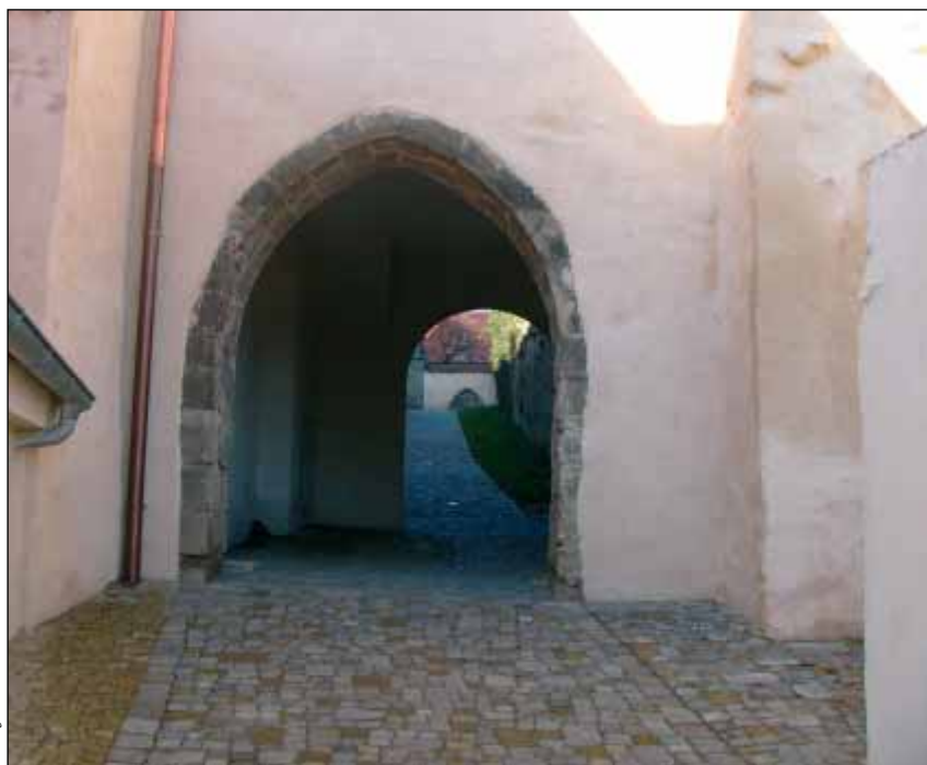
Obnovený průchod – pohled od Žerotínova náměstí

vání náhradních prostor pro čalounickou dílnu a po přesunu jejího provozu do nově vybudovaných objektů. Z hlediska čisté logiky tedy došlo k zdánlivě neřešitelné situaci, nikoli nepodobné věčné a nikdy nezodpověditelné otázce uvedené v nadpisu tohoto odstavce. Reálný život se však nedá vtěsnat do exaktně vymezených hranic přísné logiky, a tak i zde se nakonec rozumné řešení našlo. Projekt byl zpracován jen do podrobností, které umožňovaly dostupné vstupní informace. Od počátku přitom bylo zřejmé, že při realizaci stavby nutně dojde k větším či menším změnám, jejichž potřeba vyplyne až z podrobnějších průzkumů.