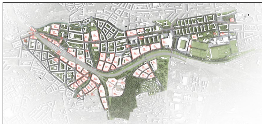
Odměna: Vršovice: Trains, Parks 'n Strolls (Faris Jašarević, Jan Stuchlík)

Projekt byl oceněn za komplexní, avšak jasně strukturovanou reakci na výzvy