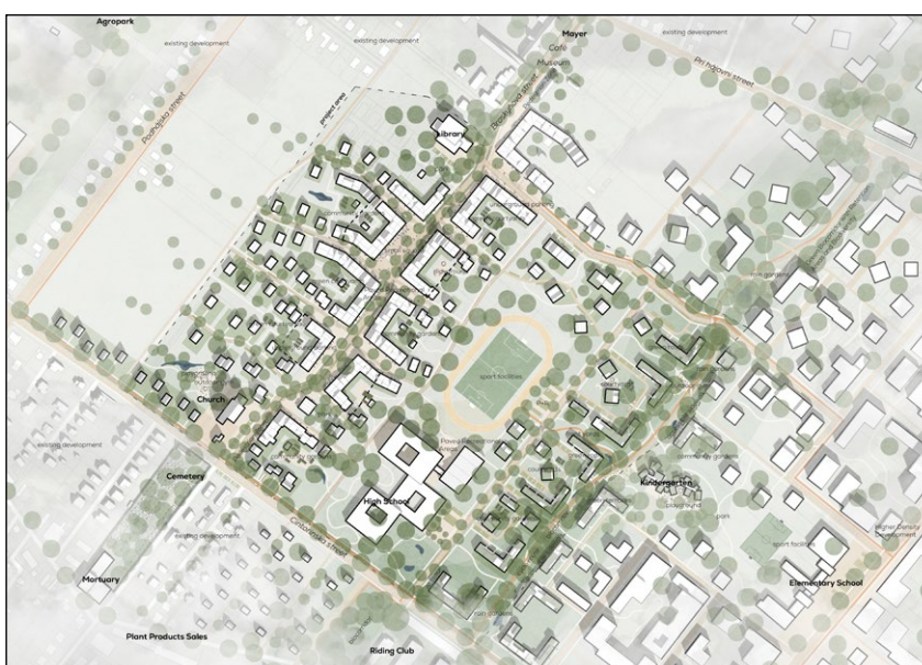
Odměna: Beyond Suburbia (Nikoleta Mitríková)

Celkově je však projekt Under Bridge – Florenc kvalitně podloženým konceptem, jehož realizace by vedla k žádoucí pozitivní transformaci daného území.