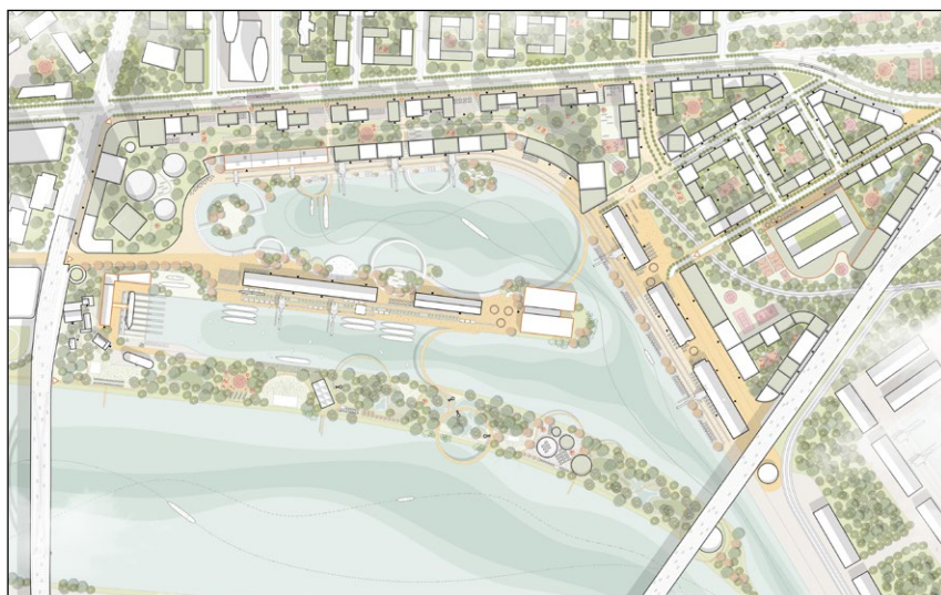
3. cena: Revitalization of the Bratislava's Winter's Harbor (Róbert Lipták)

jako dynamický systém, navrhuje infrastrukturu jako ekologické médium a organizuje zásahy napříč různými měřítky. Tyto kvality si zaslouží uznání a odůvodňují udělení 2. ceny. Právě tato citlivost k měřítku a ekologickému systému představuje typ systémového designového myšlení, který naše současná situace vyžaduje.