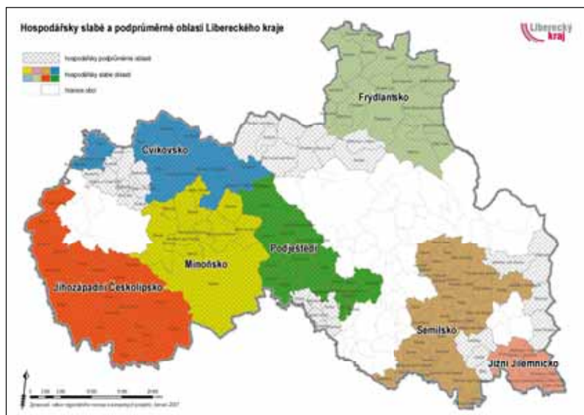
Obr. 3: Vymezení hospodářsky slabých a podprůměrných oblastí Libereckého kraje