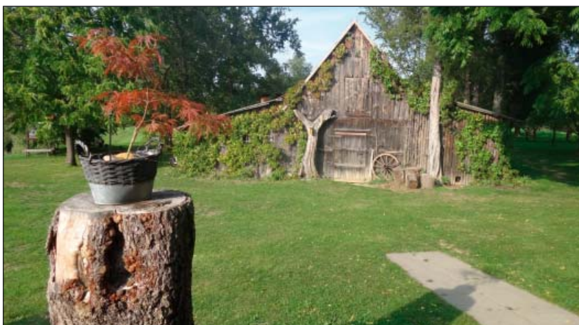
EkoFarma Sádky v Kunovicích