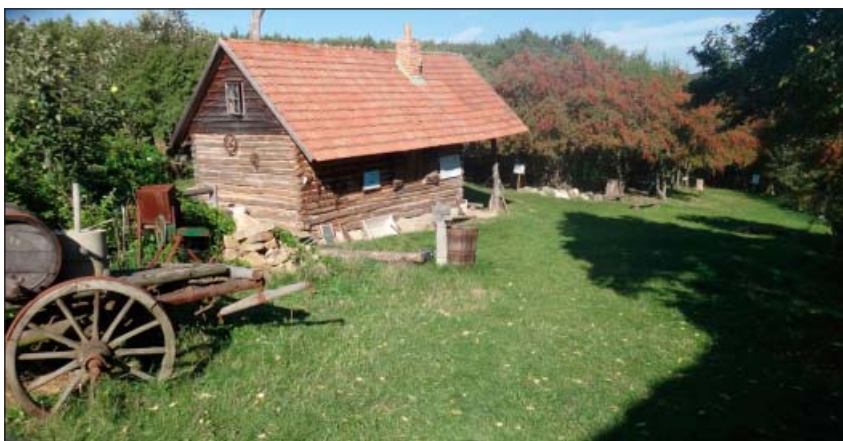
Areál Salaše Travičná ve Tvarožné Lhotě