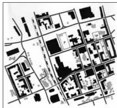
Obr. 8: Mapa aktuálního stavu s vyznačením parkovacích stání