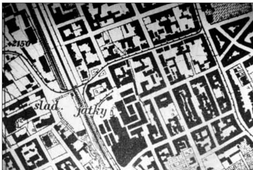
Obr. 3: Výběr části mapy z roku 1930 – kolem areálu jatek jsou plochy již zastavěny

ky a společensky vyšším architektonickým typům objektů. Horizontální hladinu rozčlenila věž, atiky a profilovaná komínová tělesa. U fasád se po-