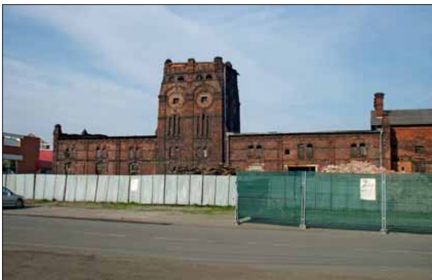
Obr. 6: Historická budova jatek za plechovou ohradou