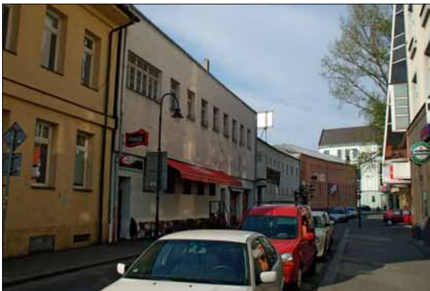
Obr. 5: Vtažení novější části jatek do městského života