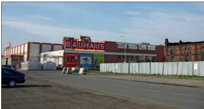
Obr. 9 a 10: Otázka pro čtenáře: Tak je to centrum města nebo periferie?

Možností, jak jatka využít, je dnes mnoho. Jednou z nich je třeba nápad Ostravské univerzity. Podle návrhu by mohl komplex sloužit pro potřebu univerzity a pro projekty Katedry výtvarného umění.