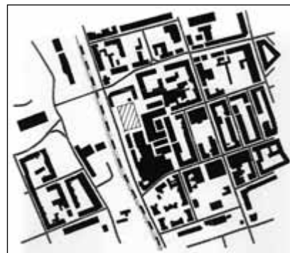
Obr. 7: Část z plánu obcí Moravské Ostravy z roku 1926

Současně s areálem bývalých věhlasných jatek se měnilo i celé okolí. Chátrající a nevyužívané objekty (určené tehdejšími územními plány k zániku) byly postupně demolovány a v původní poměrně husté zástavbě zůstalo mnoho otevřených bloků, proluk i samostatně stojících domů. Plochy po zbořených domech jsou dnes využívány pro parkování. Pro srovnání uvádíme dvě mapy – jednu z roku 1926, druhou z roku 2010.