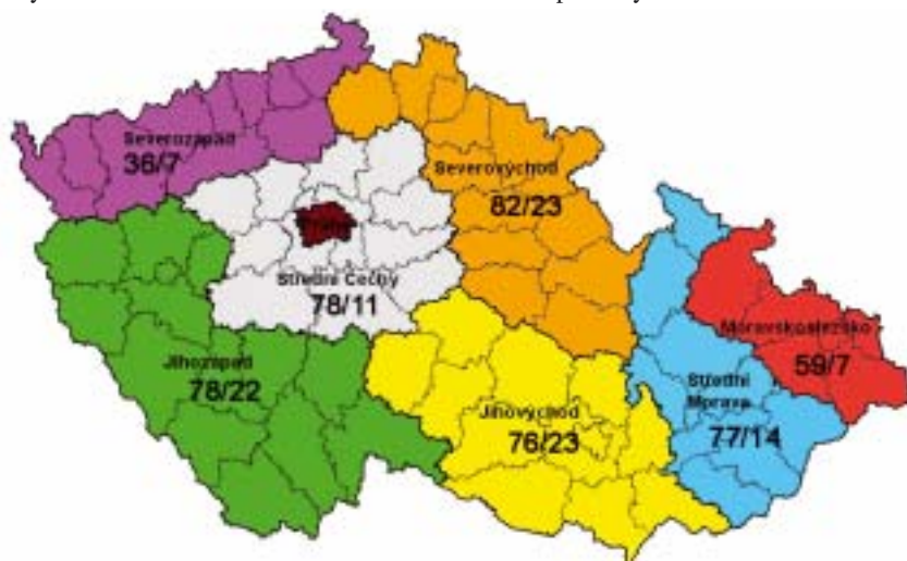
Kartogram č. 1 Přehled zaevidovaných/přijatých projektů v regionu NUTS II - Regionech soudržnosti