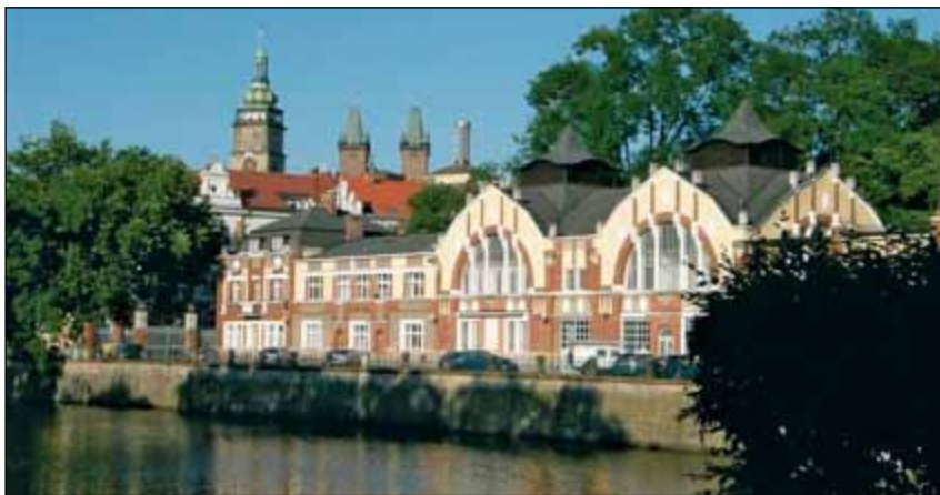
Hradec Králové, labská vodní elektrárna