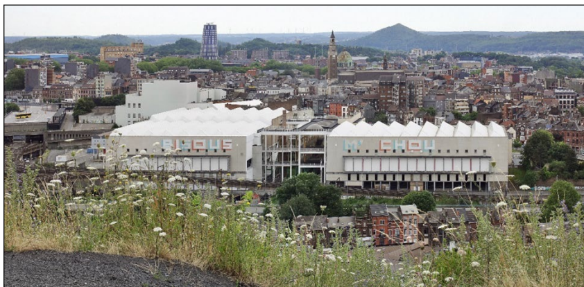
Autoři: architekti Jan de Vylder, Inge Vinck, AgwA

trum města s okolím. Otevřenost a přístupnost areálu jsou vyvažovány jeho aktivním využitím a vizuální kontrolou, nicméně dlouhodobá kvalita prostředí bude záviset především na intenzitě provozu a důsledné správě ze strany města.