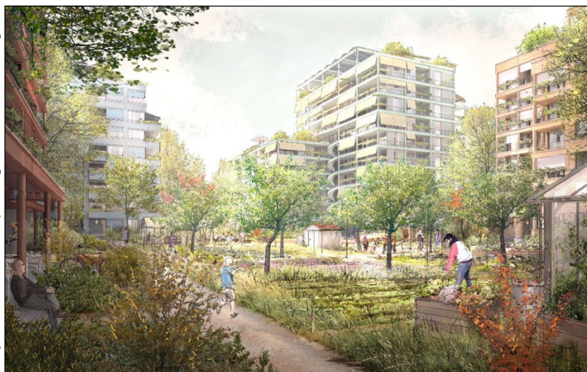
Vizualizace nové čtvrti RothNEUsiedl

může vypadat městská zástavba odolná vůči klimatické změně.