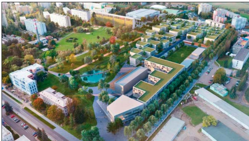
Nová čtvrť v Táboře – návrh (Norma Architekti, Sporadical)