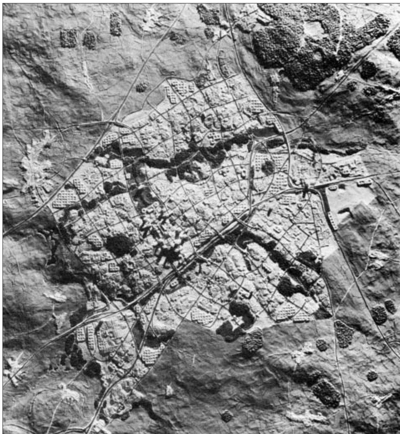
Původní představa, jak mělo vypadat nové město Milton Keynes v roce 2000

Jeho posledním veřejným vystoupením v naší zemi se stalo vyjádření k bu-