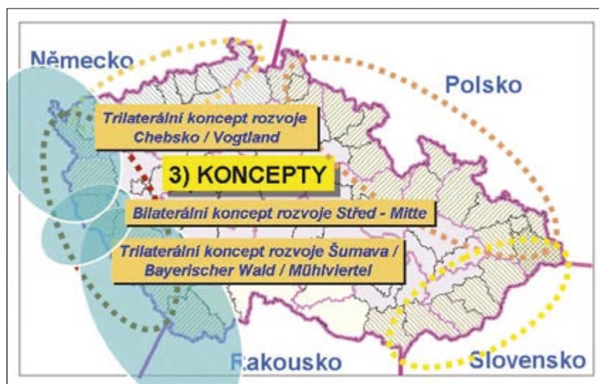
Obr. 2: Rozvojové koncepty v česko-bavorském příhraničí