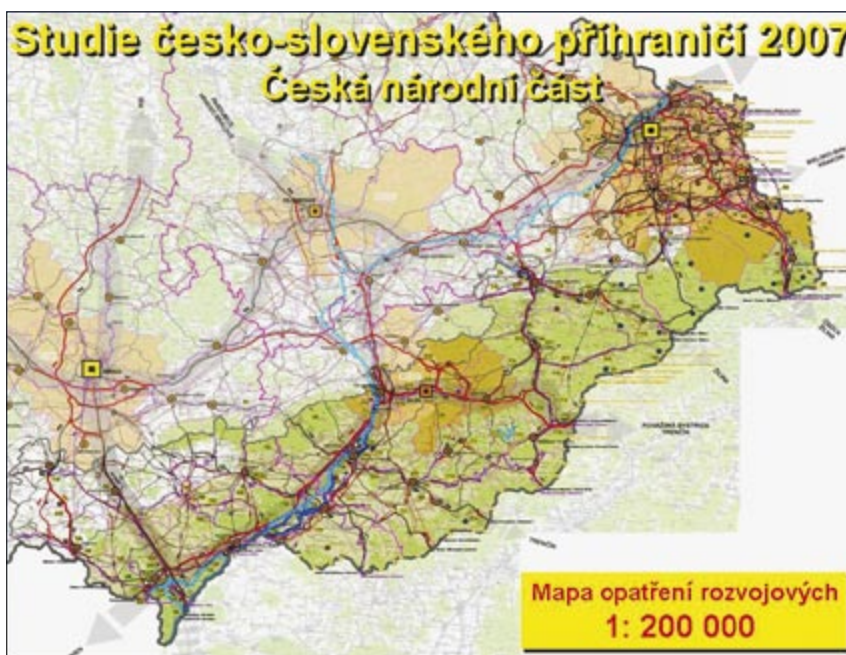
Zdroj: Studie rozvoje česko-slovenského příhraničí; 3. etapa - návrhová část pro české území