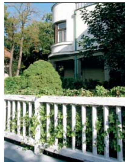
Typický rodinný dům v Králově Poli (Vodova, Vackova)

třetí a tři další projekty si město zakoupilo. Stavební úřad konstatoval, že výsledky soutěže byly tristní, problémem byla soutěžícími neřešená otázka polohy nádraží a jeho možného přeložení. Důvodem byly podklady předložené ředitelstvím drah, které všichni soutěžící vzali jako fakt a jiný způsob si nenechali navrhnout.