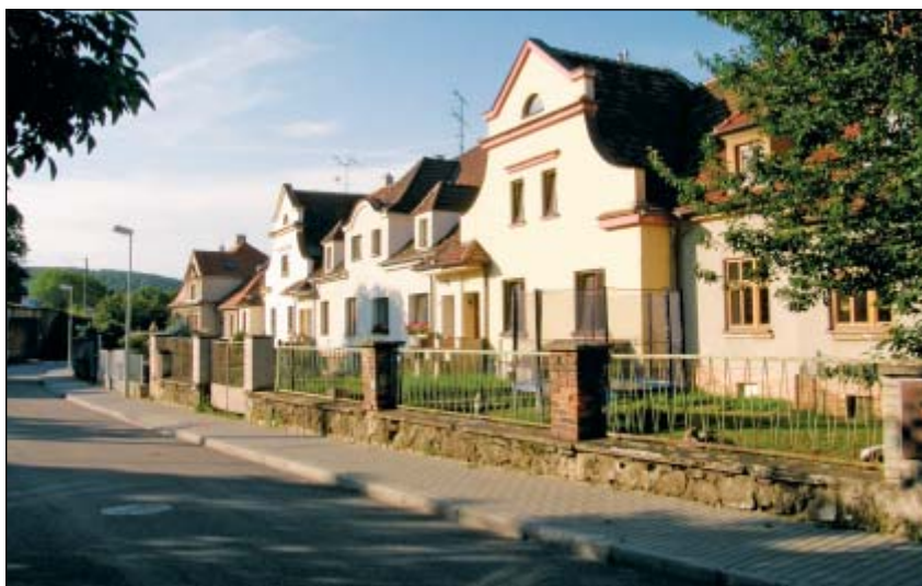
Kolonie domků pro železničáře v Řečkovících