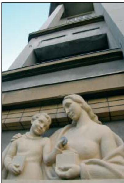
Umělecká výzdoba nově stavěných bytových domů často odkazuje na způsoby pořízení prostřednictvím půjček a spoření