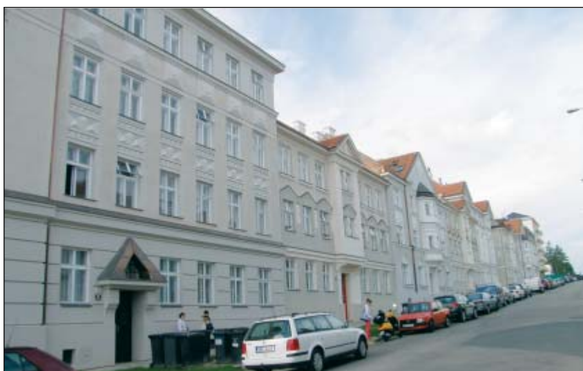
Skupina domů pro železniční zaměstnance v Králově Poli (Dobrovského)