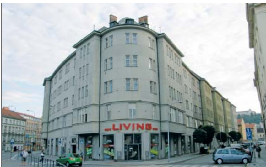
Skupina bytových domů v ulici Ypsilantiho

Na závěr ještě nutno zmínit výsledek soutěže na regulaci vnitřního Brna. Porota vybírala z osmi soutěžních návrhů. První ani druhá cena udělena nebyla, dvěma projektům byla udělena cena