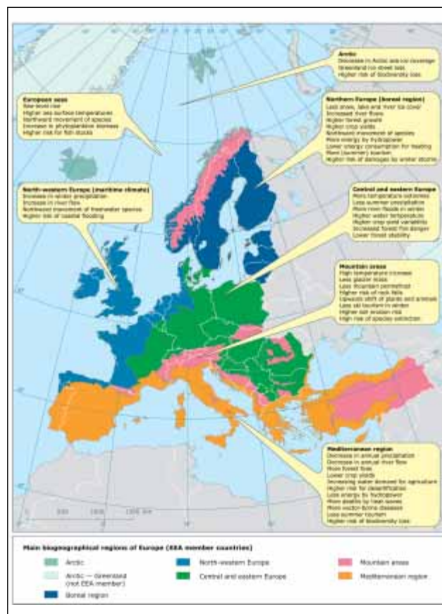
Obr. 1: Hlavní biogeografické regiony Evropy

a perspektivy území Evropské unie . Dokument obsahuje řadu mapových podkladů, které vycházejí ze závěrů analýz realizovaných v rámci programu ESPON a dále z výstupu Páté zprávy Evropské komise o hospodářské, sociální a územní soudržnosti. Dokument Stav a perspektivy území Evropské unie ve svých závěrech vymezuje nejdůležitější územní výzvy – globalizaci a hospodářskou krizi, integraci EU a rostoucí vzájemnou provázanost regionů, demografické a sociální výzvy, změnu klimatu a environmentální rizika, energetické výzvy, ztrátu biologické rozmanitosti, ohroženě přírodní, kulturní a krajinné dědictví. Dále je obsahem dokumentu analýza struktury území Evropské unie a územního dopadu evropských politik. Obrázky 1 a 2 představují příklady zpracovaných mapových podkladů uvedených v dokumentu.