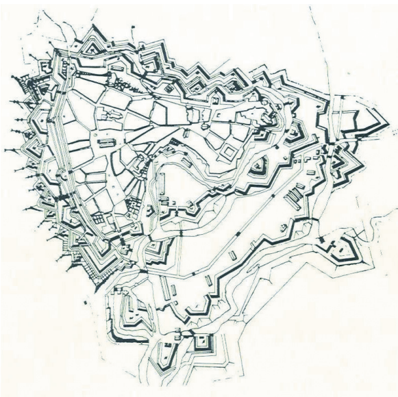
Obr. č. 2: Plán olomoucké pevnosti koncem 18. století

století v samotném centru Olomouce nebylo mnoho. Díky příslovečně konzervativnosti olomouckých městských správ se proto historický půdorys Olomouce zachoval i po odstranění hradebního krunýře bez výraznějších změn až do dnešních dnů.