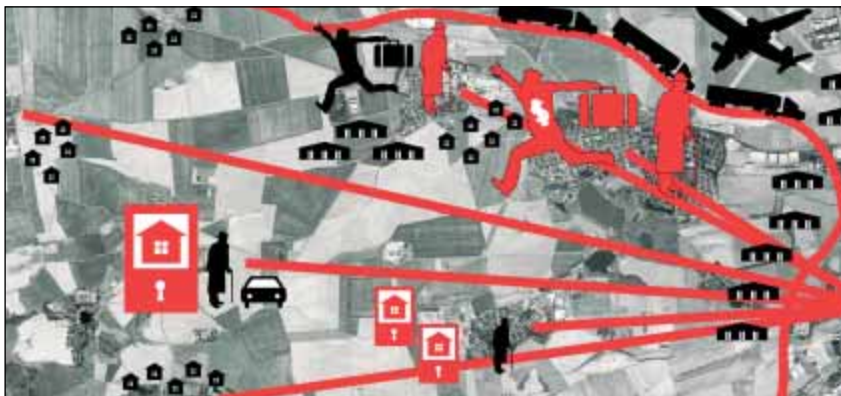
Scénář rozvoje mikroregionu 2030 – „globalizace pokračuje“