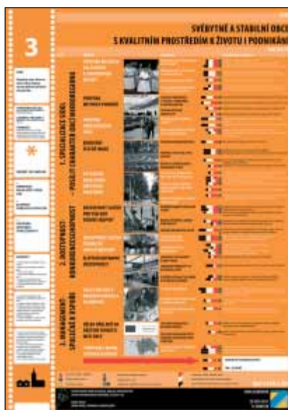
Plakát se scénáři a problémovou mapou

V problémovém výkrese a SWOT analýze prezentují hlavní hrozbu pro mikroregion, jíž je do budoucna zhoršení kvality životního prostředí, ztráta obyvatel a sociální pokles. Příležitosti je naopak zlepšení podmínek pro obyvatele, dobudování vybavení, které chybí, a stanovení priorit dalšího rozvoje. Obce na tyto výzvy mohou reagovat. Hlavní cíle tohoto strategického plánu jsou tři – prvním je specializace sídel a posílení charakteru mikroregionu. Dalším je zlepšení dostupnosti a konkurenceschopnosti a posledním management neboli „společně k úspoře“. V prvním cíli je zakotvena podpora místních kulturních a sportovních aktivit, místních podniků, podpora soběstačnosti sídel (obchodní, energetická), a dotváření image místa, které je dobré k životu (zlepšování veřejných prostor, podpora veřejné dopravy, cyklistické dopravy apod.). V druhém cíli je třeba zlepšit dostupnost služeb pro různé věkové kategorie, dohnat deficit technické infrastruktury a zlepšit dopravní dostupnost. Poslední cíl usiluje o širší společenskou debatu o budoucnosti obcí, chce podnítit zájem občanů (i dětí) o dění v obci, také se snaží uspořít prostředky obcí prostřednictvím vzájemné spolupráce a dělby některých nákladů. Konečně chce tento cíl propagovat mikroregion navenek. Z konkrétních projektů pak mohou uvést vytvoře-