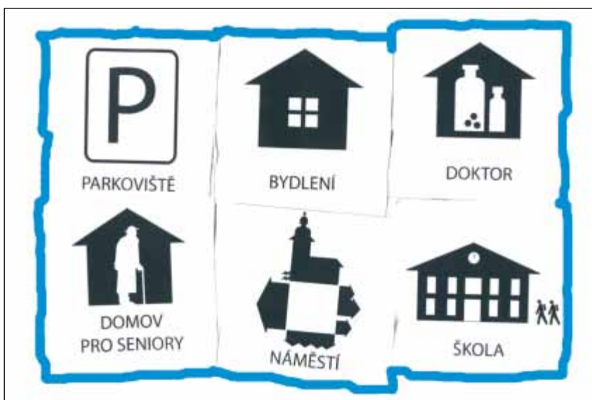
Projekt Hra – „postavte ve skupině své město“