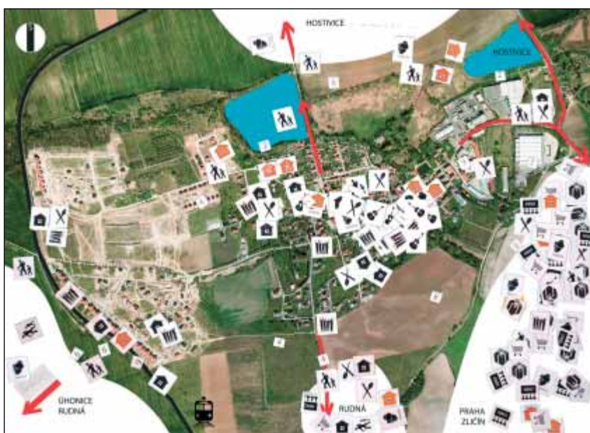
Projekt Hra – „kam jdu, když...“ – kde se odehrávají dětské aktivity?