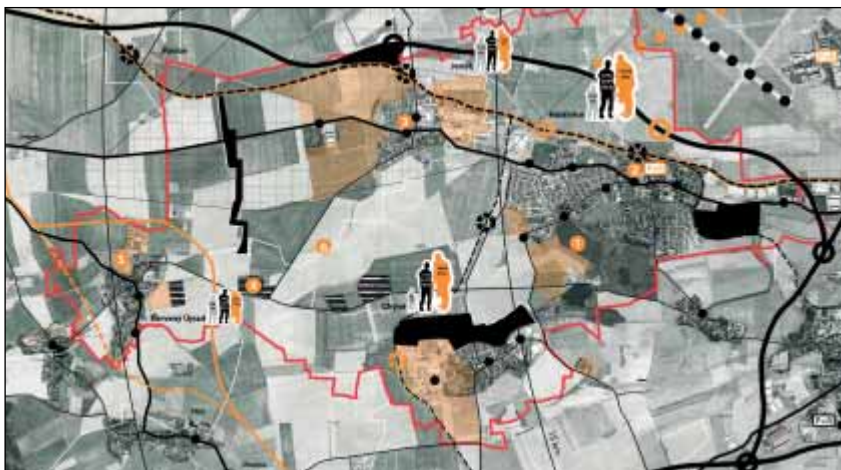
Analýza současného stavu mikroregionu

Klíčem k celému plánu jsou barvy. Není jich moc a opět mají zpřehlednit celý dokument. Černá barva znamená ve fázi analýzy stávající stav, v problémovém výkrese potom současnou silnou stránku nebo výhodu obce. Šedivá se v práci příliš nevyskytuje a hovoří o minulém vývoji. Červená barva představuje problém, současný nebo budoucí. Oranžová barva slouží pro vyjádření příležitosti a možného řešení v budoucnosti.