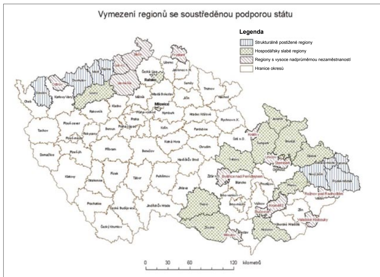
Obr. 1: Vymezení regionů se soustředěnou podporou státu

Vznik strategického dokumentu „Politika územního rozvoje ČR“ je dán potřebou územního plánování mít dokument na centrální úrovni, jenž by koordinoval územně plánovací dokumenty na nižších úrovních. Jde tak o nástroj územního plánování. Kromě toho, že politika územního rozvoje koordinuje činnosti územního plánování krajů a obcí, slouží také ke koordinaci ostatních odvětvových politik z hlediska udržitelného rozvoje území, který spočívá ve vyváženém vztahu podmínek pro příznivé životní prostředí, hospodářský rozvoj a soudržnost obyvatel území. Stanovuje rámcové podmínky pro předpokládané umístění rozvojových záměrů do vymezených oblastí, os, koridorů a ploch, a tím umožňuje