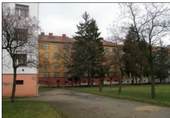
Dvorní fasády a zbytek parkové úpravy v Masarykově kolonii

Jediným urbanistickým počinem sledovaného období je Masarykova kolonie, útvar přiřazený k hlavní Pražské třídě a sestavený z domů typu „B“ do polouzavřeného bloku, kterým procházely ulice o půdorysu písmene „T“. Ramena onoho „T“ jsou souběžná s Pražskou třídou a noha se otevírá k jihu a do krajiny. Prostor vytyčený bloky domů je zajímavý skloubením veřejného a soukromého (alespoň tak, jak jej chápeme dnes). Formou jde