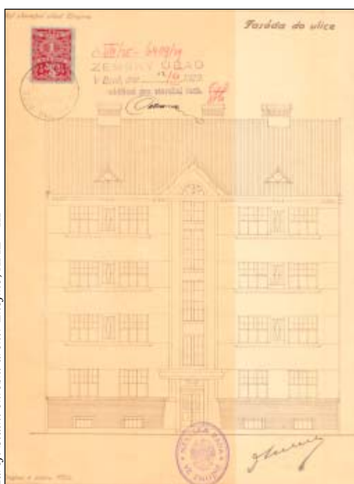
Projekt domu typu „B“, fasáda