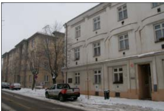
Jarošova třída, v popředí dům Domoviny, v pozadí dům pro chudé postavený městem (typ "A")

kolonie; zatímco chudší „A“ bloky se musely spokojit s klasickými dvorky v řadě za domy. Původně projektované komfortnější byty „B“ s koupelnou se nakonec postavily v jednodušší a levnější variantě, a to bez koupelny, ale součástí celé obytné kolonie byla dvoupodlažní stavba prádelny a parních lázní, která tak doplnila požadovaný komfort. Prádelna sestávala ze 12 kabin, v každé kabině bylo prkno na mydlení prádla, necky z umělého kamene a kotlík na vytváření, společný prostor mezi kabinami obsahoval čtyři pračky a dvě odstře-