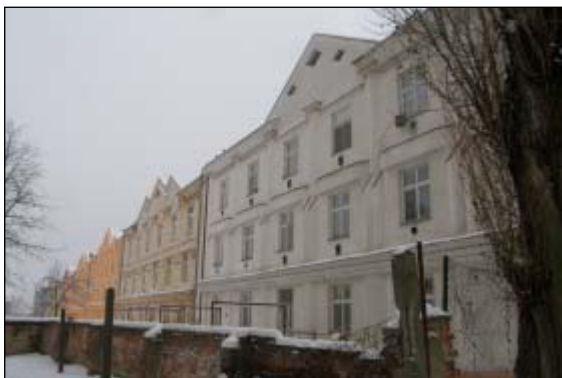
Tytěž domy, dvorní fasády