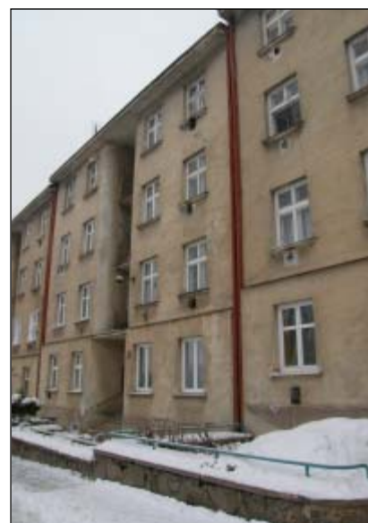
Domy typu „A“ na ulici Růženy Svobodové

„Jelikož v době mezi ofertním řízením a zadáním stavby byla umluvena nová kolektivní smlouva, zvyšuje se jako příspěvek stavebníka na vyrovnání mezd stavební náklad v této smlouvě uvedený o další 1,98 % jako náhrada na zvýšení mzdy.“