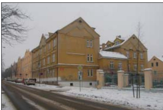
Jarošova třída s bloky domů stavebných družstvem Domovina