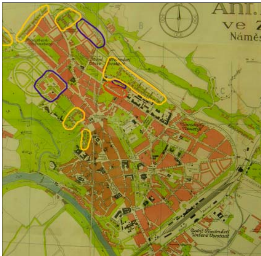
Plán Znojma asi z roku 1938, modře vyznačena Masarykova kolonie a místa s výstavbou domů pro chudé, červeně bloky bytových domů postavené Domovinou na Jarošově třídě, žlutě některé z kolonií rodinných domů stavěných bytovými družstvy