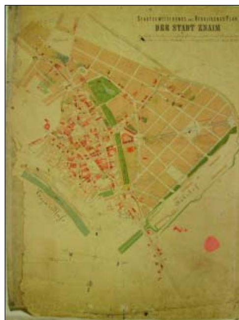
Regulační plán Znojma pořizený okolo roku 1870

V poválečném Znojmě, stejně jako ve zbytku republiky, začala vznikat stavební družstva, například Vlastní krov, Bratrstvo, stavěl zde i Rozvoj z Českých Budějovic, německý Sicherer Heim