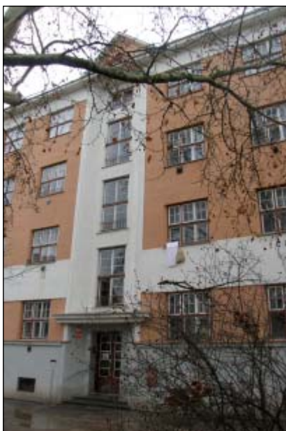
Uliční fasáda domu Masarykovy kolonie

správy na Domovinu, druhým povolení odprodeje všech dosud nesplacených a nepřevedených volných domů jiným osobám než původním čekatelům a třetím vyjednávání s věřiteli.