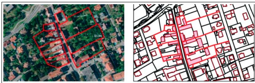
Vytipování nejstarší části obce a zákres v aktuální katastrální mapě, kde se ukazuje stále zachovalá parcelace i poloha původních později přestavovaných staveb gruntů