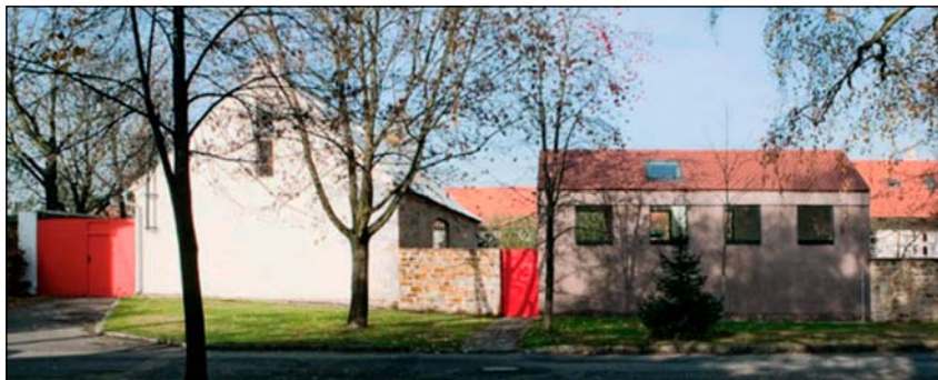
Ukázky dostaveb venkovské ulice pro drobnou výrobu, bydlení nebo obchod z ČR