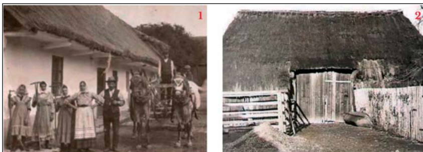
Ukázka dobových fotografií z rodinných archivů s dochovanými stavbami. Kromě toho lze nalézt i pamětníky nebo soukromé kroniky.

Urbanistický rozbor a vytipování problémů. Pro přípravu zadání a návrh ÚP je významné popsat původní urbanistickou koncepci historického jádra a rozbor funkcí v něm. Urbanista si takový popis ani nemusí písemně dokladovat protože si jej uvědomuje, pro zastupitele je ale takový rozbor důležitý a měl by být součástí doplňujících průzkumů a rozborů.