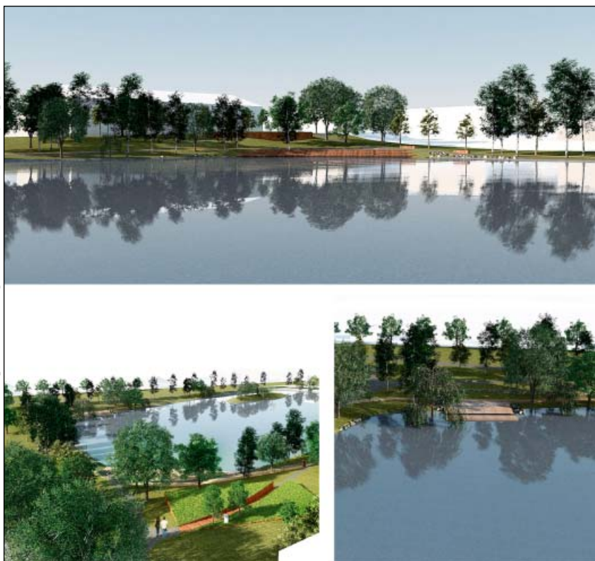
Vizualizace – rybník