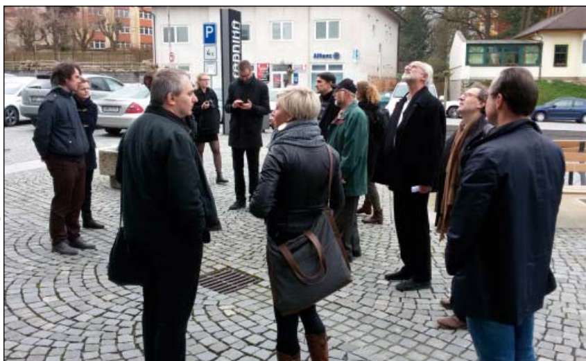
Workshop v ulici města