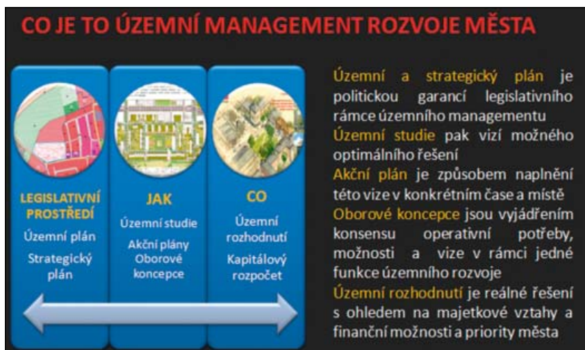
Schéma územního managementu

územního plánování nezastupitelnou roli, a to především v určení základní vize (koncepce) rozvoje území.