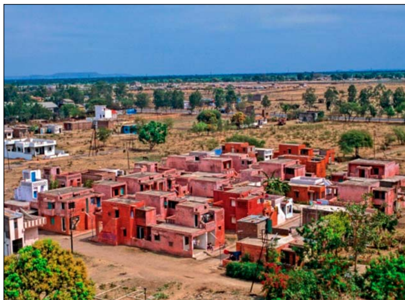
Aranya Low Cost Housing, Indore, India (1989)

Balkrishna Doshi za svou sedmdesátiletou kariéru a více než sto realizovaných projektů ovlivnil svou praxí i výukou směřování architektury v Indii a přílehlých regionech. Jeho stavby v sobě spojují průkopnický modernismus s vernakulárním stylem a jsou podloženy hlubokým pochopením tradic indické architektury, klimatu, místní kultury a řemesel. Jeho projekty zahrnují administrativní a kulturní zařízení, sídliště a obytné budovy. Stal se mezinárodně známým díky svým vizionářským urbanistickým projektům a projektům sociálního bydlení, stejně jako díky své práci v oblasti vzdělávání, a to jak v Indii, tak jako hostující profesor na univerzitách po celém světě.