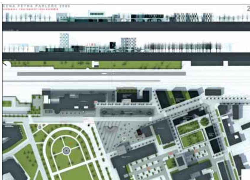
Cena Petra Parlěže 2009