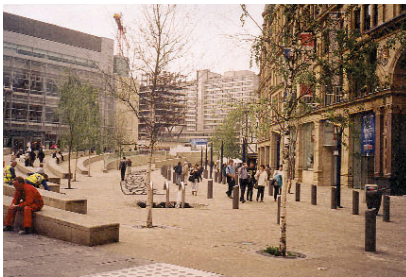
Obr. 2: Jedním z nově upravených náměstí je Exchange Square. Náměstí je vymezeno historickou i současnou zástavbou, přičemž jedna strana náměstí je ještě ve výstavbě. Vlastní plocha svažitého náměstí je pojata jako soustava teras ohraničených kamennými sokly – lavicemi. V dolní části náměstí je extravagantní vodní prvek – nerezové roury chrlí vodu, která pak protéká mezi kamennými krami. Poněkud podivným dojmem působí dvouřadá březová alej lemující vodní dílko.

Získané prostředky byly využity převážně k regeneraci veřejných prostorů – několika nejvýznamnějších náměstí a ke znovuzprovoznění plavebních kanálů, které jsou pro město charakteristické.