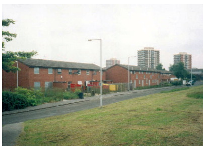
Obr. 14: Částečně opuštěné řadovky působí depresivním dojmem a rozhodně nelákají k nastěhování. A ten, komu se podaří sehnat dobrou práci se odtud raději stěhuje na lepší adresu.

Zcela odlišný charakter má problematika obnovy rozsáhlého území Východního Manchesteru. Toto území je vnímáno jako město sociálně slabších obyvatel, kvalita jeho prostředí má dlouhodobě sestupnou tendenci a tak není jako dobrá adresa pro život vyhledáváno.