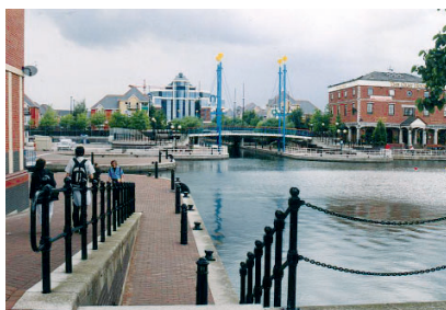
Obr.12: Průhled je zakončen jednou z administrativních budov

Do další skupiny můžeme zařadit původně neplánované administrativní soubory. Místo kontinuální bytové zástavby zde trčí jako torza doby, ve které vznikaly, monumentální solitéry komponované na osy kanálů.