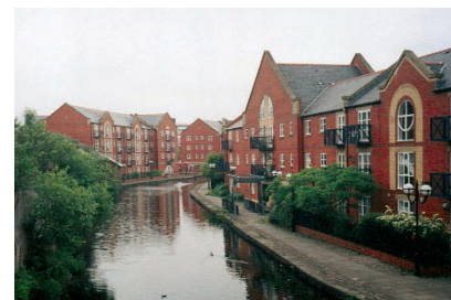
Obr.15: Část nové zástavby East Manchesteru, realizované podle nového plánu regenerace .

Od roku 1999 je zpracováván plán regenerace, na kterém se podílí mnoho konkurzem vybraných firem. Při realizaci se počítá se státními i soukromými investicemi. První realizovanou akcí je výstavba sportovního areálu s fotbalovým stadionem, kde se budou konat Hry Spojeného království 2002. V území se plánuje nejen nová výstavba a přestavba historických průmyslových a skladových areálů, ale i destrukce nevyhovujících věžových panelových domů ze 60. let a dokonce i řadových domů postavených v minulé dekádě. Toto území je degradováno natolik, že se přistupuje k investici do téměř 100% asanace území. Taková investice bude obnášet v průběhu příštích 15-ti až 20-ti let 1,5 – 2 miliard GBP ze soukromého sektoru a 300 – 400 miliónů GBP z veřejných prostředků. Celkem se zde plánuje 15 000 nových bytových jednotek a 10 000 pracovních příležitostí. Záměrem je vytvořit nové město pro 60 000 lidí.