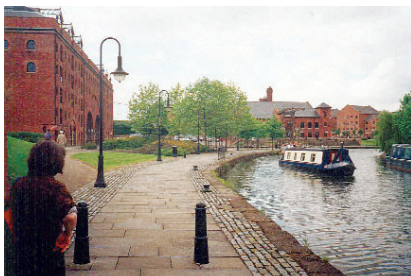
Obr. 6: Kanál s vysokou vodní hladinou vypadá jako silnice s podivnými vozidly – narrowboaty.

žeme vidět základy obytných stavení. Výjimečným prvkem v území je vlastní kanál, který se od ostatních kanálů ve městě liší výškou vodní hladiny dosahující téměř až k chodníku.