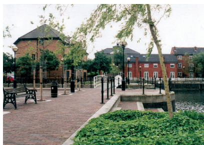
Obr.11: Kvalitní a finančně jistě náročná úprava nábřeží byla realizována v celém území již v první etapě.

Do další skupiny můžeme zařadit původně neplánované administrativní soubory. Místo kontinuální bytové zástavby zde trčí jako torza doby, ve které vznikaly, monumentální solitéry komponované na osy kanálů.