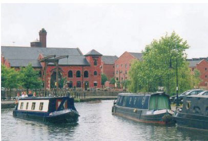
Obr. 7: Jedna z nejhezčích částí Castlefieldu.

Území Castlefieldu je velmi rozmanité, přesto však nepůsobí rozříštěně. Tento historický celek je doplněn novostavbami z režného zdiva ale i moderními ocelovými konstrukcemi, které dojem z původního prostředí neruší. Přesto, že poměr původních a nových staveb je v podstatě 1:1, bylo toto území prohlášeno památkovou rezervací. Měřítko staveb i prostoru kolem zůstává lidské a v návštěvníkovi zanechává mnohem silnější dojem, než monumentální a od pohledu drahé novostavby v Salford Quays.