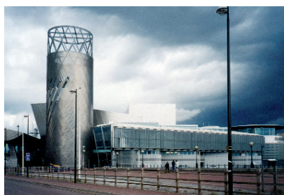
Obr.13: The Lowry.

Novou krev do dokončení záměru nalil příliv nových financí až koncem 90. let. Jakkoli jsou administrativní objekty velké a monumentální, v poměru k nově vznikajícím komplexům, které můžeme zařadit do třetí skupiny, působí jako drobné stavby.