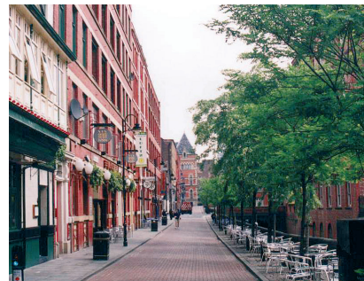
Obr. 4: Znamením, že se z těchto zanedbaných oblastí stala atraktivní lokalita s „dobrou adresou“, je množství kaváren se zahrádkami na nábřeží kanálu.

přitažlivosti svědčí fakt, že luxusní a velmi drahé byty byly okamžitě rozprodány. Z těchto nábřeží se staly jedny z nejpříjemnějších prostranství v Manchesteru.