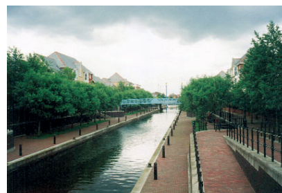
Obr.10: Z původních doků zůstala jen půdorysná stopa a některé prvky - nábrežní kameny, polery. Zasvěcení tvrdí, že původní je jen ta voda.

Výstavba v této lokalitě by se dala rozdělit do tří skupin. První skupinou jsou realizace podle původního záměru. Jedná se o levně vypadající dvou, až třípodlažní