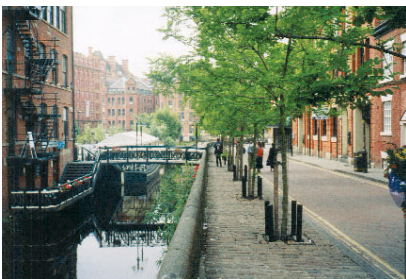
Obr. 3: Realizovaná úprava veřejných prostorů přispívá k celkově dobrému dojmu ze zdařilých rekonverzí průmyslových objektů stojících na nábřeží kanálů.

Zcela mimořádná pozornost při přestavbě města byla věnována úpravě kanálu a starých skladišť na jeho nábřeží. Rekonstrukce byla rozdělena na dvě etapy. První z nich se soustředila na úpravu vlastních domů – přestavbu na luxusní domy s byty a se službami v parteru. Druhá etapa znamenala vyčištění a znovuzprovoznění plavebního kanálu, který je využíván typickými a všudypřítomnými narrowboaty. Rochdale Canal se stal osou nového atraktivního území v celé své délce na jihovýchodním okraji centra. O jeho