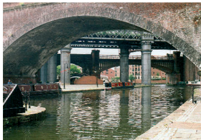
Obr. 5: Mimoúrovňové křížení původní železnice ponechané v prostoru Castlefieldu, dodává tomuto území exotické pozadí.

Nyní po rozsáhlé rekonstrukci je tu přitažlivé místo jak pro obyvatele, tak pro turisty. Muzea, novostavby bytových domů i původní sklady bavlny přestavěné na domy hotelového typu – to vše je zasazeno do exotického industriálního prostředí.