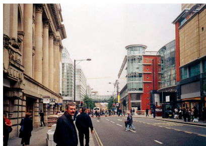
Obr. 1: Obchodní ulice Cross Street byla dějištěm teroristického útoku. Jak je patrné, objekty supermarketů již dostaly nový obsah i tvář.

Zlomem v historii Manchesteru byl puňový atentát zorganizovaný IRA v roce 1996. Bomba v zaparkovaném automobilu způsobila výbuch před obchodním domem, zdemolovala několik objektů a zभावila okna a výkladů domy na kilometr daleko. Jako zázrakem nikdo nepřišel o život. Tento teroristický čin byl impulsem k mobilizaci rezerv a k úvahám o komplexní přestavbě městského centra.