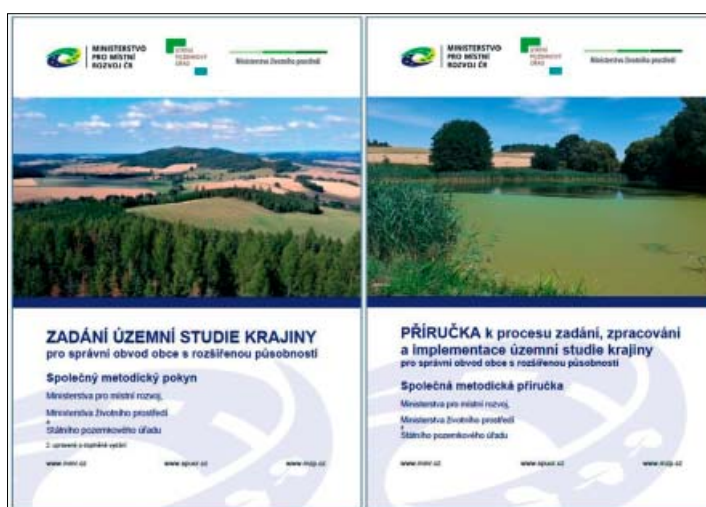
Nové metodické dokumenty k ÚSK

Zatímco Metodický pokyn se soustředí na formulaci zadání ÚSK, Příručka se zabývá celým životním cyklem ÚSK od přípravy zadání přes výběr zhotovitele ÚSK, tvorbu doplňujících průzkumů a rozborů a tvorbu návrhu ÚSK až po použití již dokončené a schválené ÚSK v praktické činnosti orgánu územního plánování, jakož i dalších významných aktérů, jako jsou orgány ochrany přírody, pozemkové úřady (při pořizování pozemkových úprav), stavební úřady (při posuzování souladu záměru s cíli a úkoly územního plánování v případech, kdy se nevydává závazné stanovisko orgánu územního plánování podle § 96b stavebního