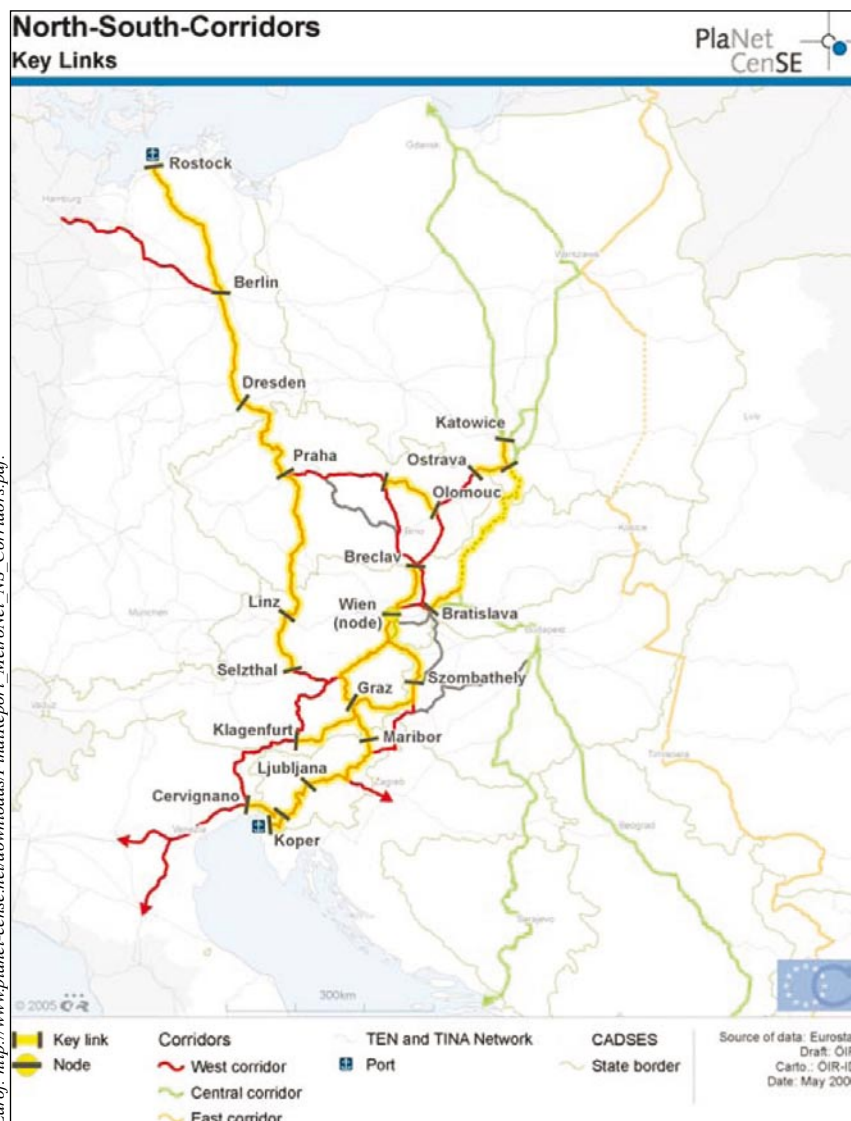
Obr. 2: Klíčová spojení (žlutě) v rámci severo-j jižních koridorů ve střední Evropě definovaných projektem PlaNet CenSe