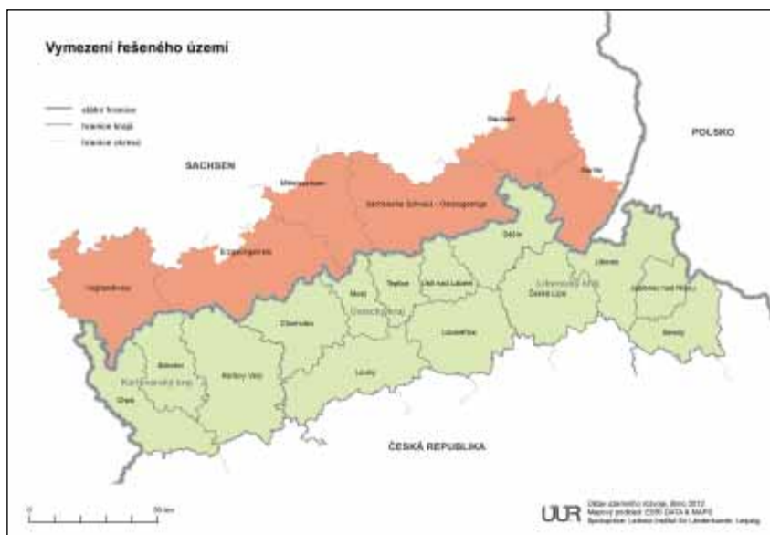
Česko-saské příhraničí – řešené území