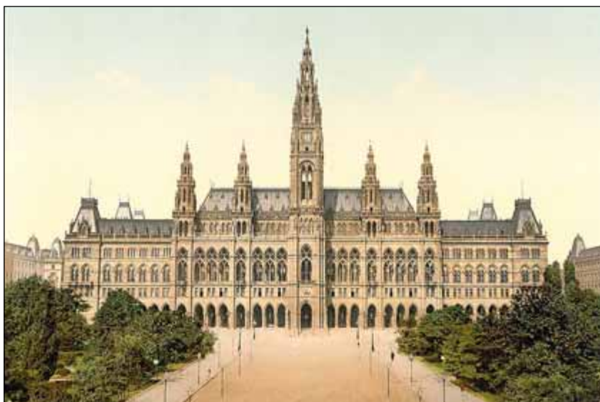
Ringstraße kolem roku 1900 – Vídeňská radnice (Rathaus). Stavba v neogotickém stylu s 103,3 metrů vysokou věží byla postavena v letech 1872–1883 podle projektu architekta Friedrich von Schmidta.

ny a 3. října 1859 předloženy novým ministrem vnitra Agenorem hrabětem Goluchowskim – po porážce u Solferina 24. června 1859 musel totiž ministr Bach, jehož podíl byl v počátečních fázích politicko-administrativního plánování rozhodující, svůj úřad opustit – císaři k definitivnímu schválení, které bylo uděleno 8. října 1859. Ještě před tím byl dán 3. října návrh základního plánu k posouzení veřejností v denících a časopisech.