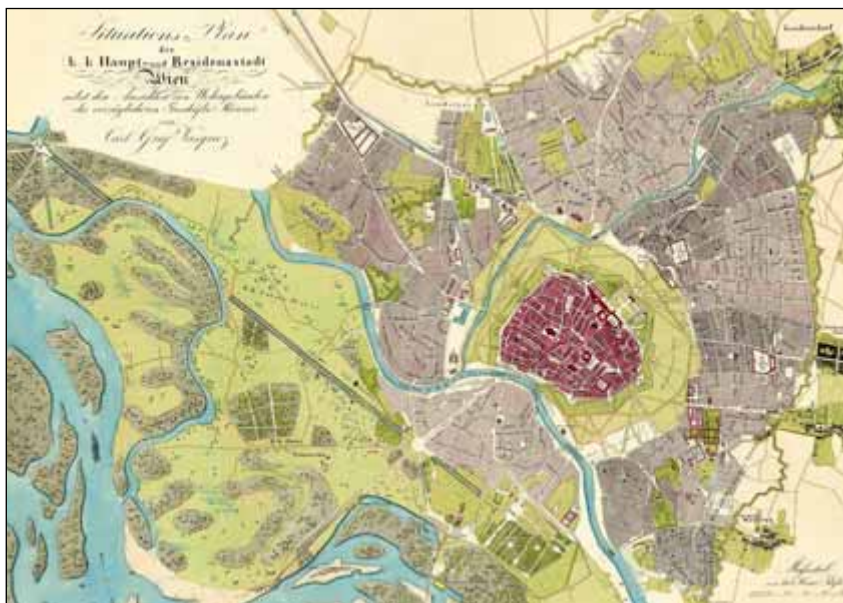
Karte von Wien, Carl Graf Yasquez, cca 1830, Wikimedia Commons

Tyto přípravné práce na rozšíření města byly ještě neveřejné, a proto byla veřejnost docela překvapena, když byl tento přípis 25. prosince 1857 v plném znění zveřejněn ve Wiener Zeitung. Tím okamžikem se rozpoutala bouřlivá diskuse o rozšíření města mezi odbornou veřejností i mezi obyvateli Vídně.