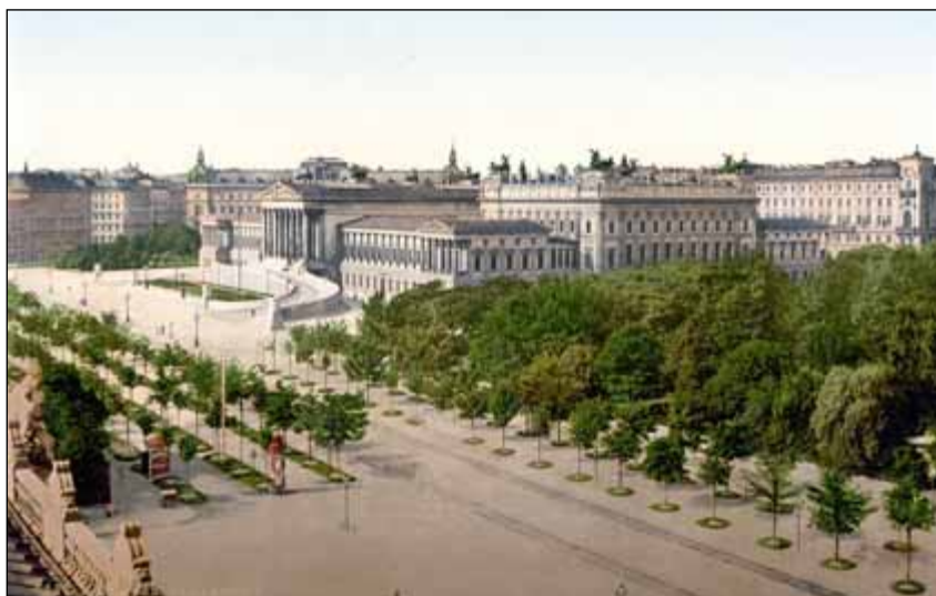
Litografie mezi lety 1890–1900

Protože nebyl žádný ze soutěžních návrhů vybrán jako vítězný, pověřil císař František Josef I. ministra Bacha 25. prosince 1858 vedením porad nad konečným návrhem základního plánu, ve kterém by byly zohledněny myšlenky oceněných projektů. Byla stanovena komise, která měla z předložených návrhů sestavit definitivní základní plán. Vlastní návrhy nezávisle na sobě předložili také sekční rada von Löhr 3) a profesor von Förster 4) . Tyto dva nedochované návrhy se pak staly bázi pro jednání komise. Koncept návrhu byl 13. dubna 1859 předložen komisi, do které byli přibráni reprezentanti jiných odvětví, aby bylo možno zapracovat i jejich připomínky. 5)