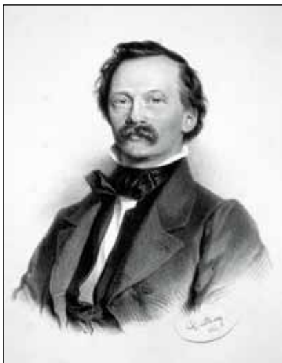
Cajetan svobodný pán von Felder (1814–1894). Purkmistr Vídně (1868–1878) se významně a aktivně zapsal zejména do závěrečné fáze plánování Ringstraße.

z jeho iniciativy v tomto deníku třídílná série článků Architektonická budoucnost Vídně .