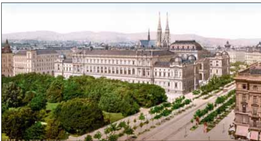
Ringstraße kolem roku 1900 – Vídeňská univerzita. Hlavní budova univerzity na Ringstraße byla vybudována mezi lety 1877–1884 podle návrhu architekta Heinricha von Ferstela.