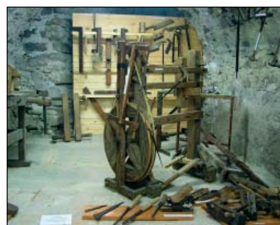
Chanovice – muzeum

V rozsáhlém sklepení zámku je Muzeum řemesel, v horních patrech jsou školní třídy. Budovy hospodářského dvora byly upraveny pro Galerii nositelů tradic lidových řemesel, Informační centrum a tělocvičnu pro školu i veřejnost, jsou zde i služební byty. Areál zámku a dvora je obklopuje anglický zámecký park. Barokní vrchnostenská sýpka v sousedství byla opravena v roce 2007 a slouží jako depozitář muzea lidové architektury. Historické jádro Chanovic je od roku 2004 vesnickou památkovou zónou.