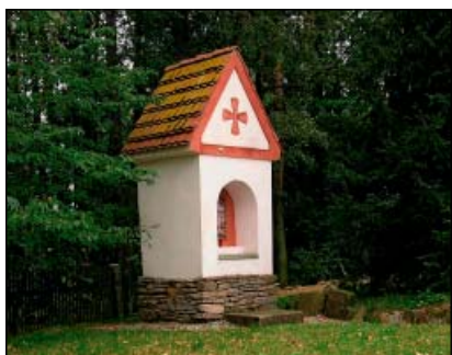
Chanovice – Boží muka

V 90. letech minulého století získalo klatovské muzeum vhodný pozemek pro vybudování skanzenu. Zejména do roku 2006 však vznikl skanzen především díky dobrovolnické práci studentů z Plzeňského kraje, kteří pomáhají i nadále jak při výstavbě, tak při údržbě již přenesených objektů. Skanzen v Chanovicích však nejen zachraňuje historické objekty, ale aktivně se zapojuje do regionálního cestovního ruchu. Každoroční Den řemesel a další četné akce mají vysokou návštěvnost a jsou dokladem zájmu veřejnosti o lidovou kulturu.