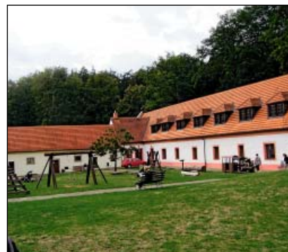
Chanovice – zámecký areál

V rozsáhlém sklepení zámku je Muzeum řemesel, v horních patrech jsou školní třídy. Budovy hospodářského dvora byly upraveny pro Galerii nositelů tradic lidových řemesel, Informační centrum a tělocvičnu pro školu i veřejnost, jsou zde i služební byty. Areál zámku a dvora je obklopuje anglický zámecký park. Barokní vrchnostenská sýpka v sousedství byla opravena v roce 2007 a slouží jako depozitář muzea lidové architektury. Historické jádro Chanovic je od roku 2004 vesnickou památkovou zónou.