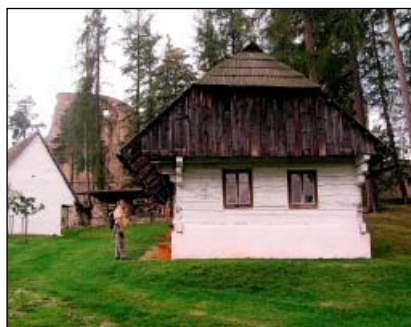
Velhartice – skanzen

Od 90. let 20. století začala správa státního hradu Velhartice v předhradí realizovat záchranný projekt věnovaný uchování historických lidových staveb, které nebylo možné ponechat na původním místě. Soubor staveb zahrnuje obytná stavení a hospodářské stavby budované převážně ze dřeva, v malé míře i z kamene a od konce 19. století z pálených a nepálených cihel.