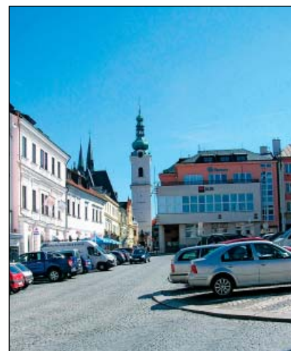
Klatovy – Bílá věž

Dominantou centra Klatov je městská radniční věž, nazývaná Černá, která v 16. století přiléhala k budově radnice. Na západní straně náměstí stojí jezuitský kostel sousedící s bývalou jezuitskou latinskou školou. Ve východní části historického jádra se nachází děkanský kostel, jehož zvonice, stojící v těsné návaznosti, se nazývá Bílá věž. Na obvodu historického jádra se dochovaly pozůstatky složitěho fortifikačního systému města. Turistickou atrakcí je někdejší jezuitská barokní lékárna „U bílého jednořozce“, jejíž interiér je unikátně dochovaný, atraktivitu pro návštěvníky zvyšuje i původní laboratoř s četnými ukázkami tehdejších léčebných prostředků.