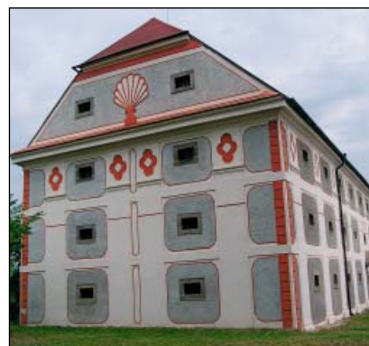
Chanovice – vrchnostenská sýpka

Současně však pokračovala devastace dvora, který využívalo místní JZD. Tento proces se zastavil v roce 1990 a následující citlivé úpravy nejen zachránily již těžce zdevastovaný cenný areál, ale umožnily jeho plné využití. Financování rekonstrukce bylo umožněno s příspěvím programu Phare a později fondů EU.