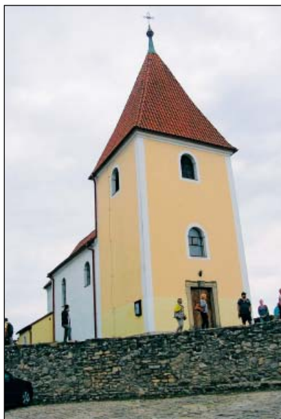
Chanovice – kostel Sv. Kříže

Vesnice Chanovice byla písemně doložena v polovině 14. století. Dochovaným středověkým jádrem obce je vrchnostenský dvůr sousedící se zámeckou budovou, původně tvrzí, a s kostelem sv. Kříže. Pozdně románský kostel byl barokně přestavěn spolu s původní tvrzí a vrchnostenským dvorem v průběhu 18. století, tehdy byla rovněž vybudována mohutná vrchnostenská sýpka. Ve 2. polovině 20. století byly objekty kostela a zámku rekonstruovány.