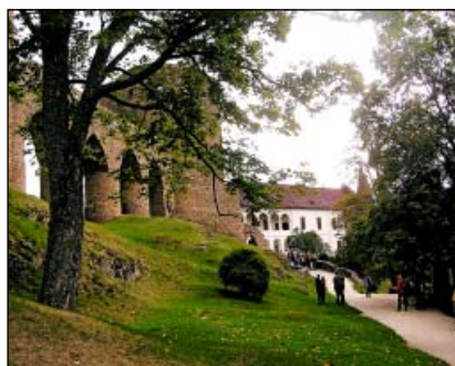
Velhartice – hrad

Významný gotický hrad Velhartice, jehož jižní část byla v 17. století přestavěna a doplněna na renesanční palác, je již od počátku 19. století částečnou zříceninou, dochovala se však skladba jeho jednotlivých částí. Zcela ojedinělý je kamenný most se čtyřmi oblouky, který spojuje severní původní hradní budovu s předsunutým donjonem.