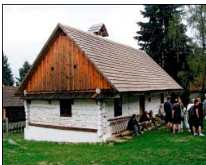
Chanovice – skanzen