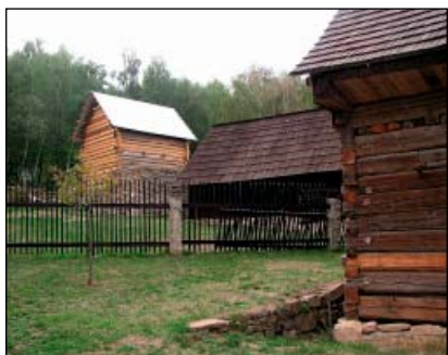
Chanovice – skanzen

V 90. letech minulého století získalo klatovské muzeum vhodný pozemek pro vybudování skanzenu. Zejména do roku 2006 však vznikl skanzen především díky dobrovolnické práci studentů z Plzeňského kraje, kteří pomáhají i nadále jak při výstavbě, tak při údržbě již přenesených objektů. Skanzen v Chanovicích však nejen zachraňuje historické objekty, ale aktivně se zapojuje do regionálního cestovního ruchu. Každoroční Den řemesel a další četné akce mají vysokou návštěvnost a jsou dokladem zájmu veřejnosti o lidovou kulturu.