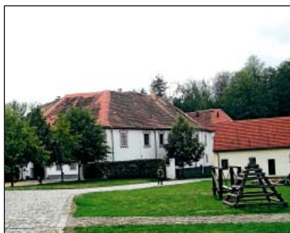
Chanovice – zámek

Současně však pokračovala devastace dvora, který využívalo místní JZD. Tento proces se zastavil v roce 1990 a následující citlivé úpravy nejen zachránily již těžce zdevastovaný cenný areál, ale umožnily jeho plné využití. Financování rekonstrukce bylo umožněno s příspěvím programu Phare a později fondů EU.