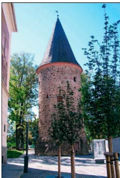
Klatovy – hradby

Součástí prvního dne semináře byla prohlídka centra města Klatovy, které je od roku 1992 památkovou zónou.