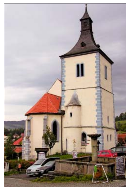
Velhartice – kostel Narození Panny Marie

Druhý den semináře byl již tradičně věnován exkurzi, jejímž cílem byly dvě lokality – Velhartice a Chanovice.