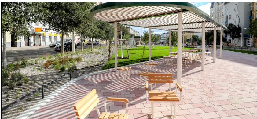
Pobytová kvalita místo parkoviště: nový Naschpark ve Vídni

A Vídeň v tomto příběhu pokračuje: nové inovativní prvky v nabídce zeleně, dobrá dostupnost zelených ploch, podpora drobného podnikání, využití parteru pro funkce centra – vedle maloobchodu zejména i pro veřejně prospěšná zařízení,