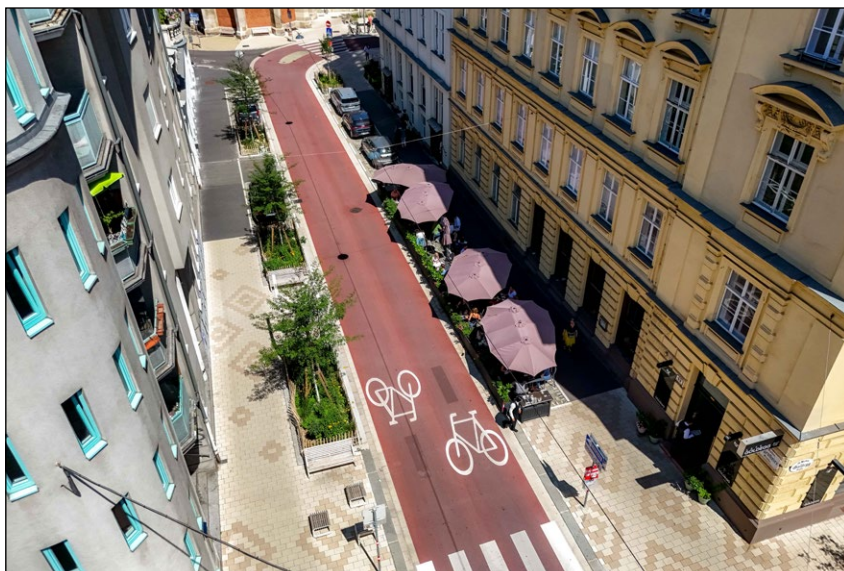
Z ulice Argentinierstraße se stala první vídeňská cykloulice podle nizozemského vzoru. Z této nové úpravy profitují i chodci

Všechny tyto požadavky na plánování se v konečném důsledku projevují nejen v nových rozvojových oblastech, ale také v řadě rozmanitých opatření ve stávající městské zástavbě. Pod heslem „Pryč s asfaltem“ se v minulých letech víc než kdykoli předtím investovalo do transformace veřejného prostoru. Ozeleňování, ochlazování, zklidňování dopravy a zlepšování podmínek pro aktivní mobilitu – chůzi a cyklistiku – také odpovídá principu 15minutového měs-