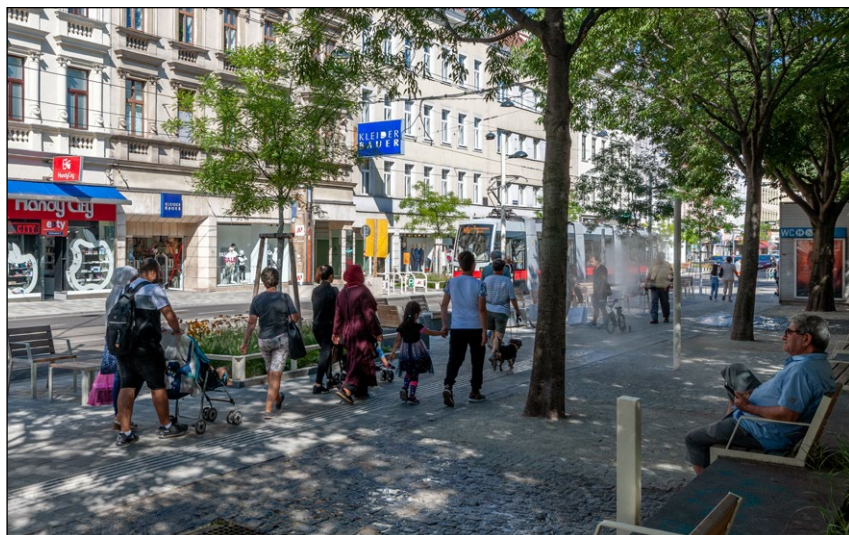
Stávající centra a nákupní ulice jako Thaliastraße v Ottakringu se dále vylepšují a posilují klimatickou odolnost

milník: poprvé v něm byly formulovány konkrétní strategie pro plánování stávajících a nových center. Odborný koncept plní dvě úlohy: identifikuje místa ve městě, která plní funkci centra nebo ji mají rozvíjet, a popisuje pole činností, která se uplatňují při zkvalitňování a etablování městských prostorů. Rozvoj center byl vnímán jako úkol, na kterém se mohou podílet všichni a který se může zdařit pouze tehdy, budou-li na něm všichni spolupracovat: administrativa a politika, developéři, městské okresy, obyvatelé, budoucí uživatelé i podnikatelé.