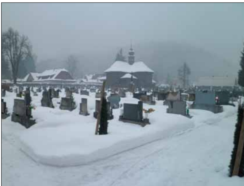
Dřevěný kostel ve Velkých Karlovicích se hřbitovem

Vymezení, Charakteristika potenciálu ČR (se samostatným pojednáním o přírodním a kulturním potenciálu), Charakteristika infrastruktury ČR a Závěr, resp. Závěr, specifické doporučení.