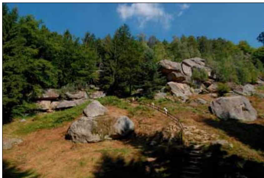
Národní přírodní rezervace Pulčinské skály – Javorníky

Návratnost dotazníků byla ze stran MAS (po dvou postupných urgencích) takřka devadesátiprocentní, v případě DSO méně než padesátiprocentní. To potvrdilo mj. tezi, že problematika cestovního ruchu se v současnosti již většinou řeší na úrovni MAS a nikoliv DSO.