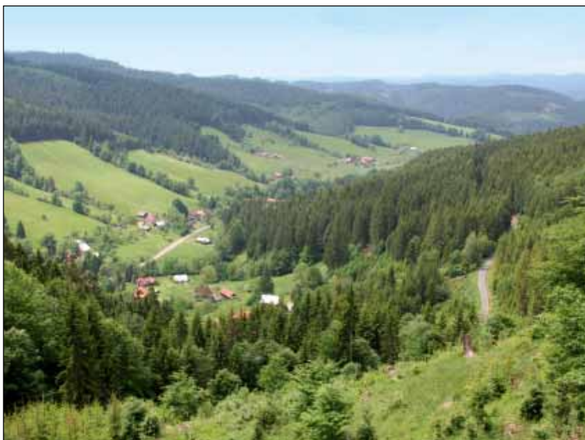
Velké Karlovice – Podřáté – typické dlouhé karpatské údolí s rozptýleným osídlením

Bilance za jednotlivé kraje vypadala následovně: