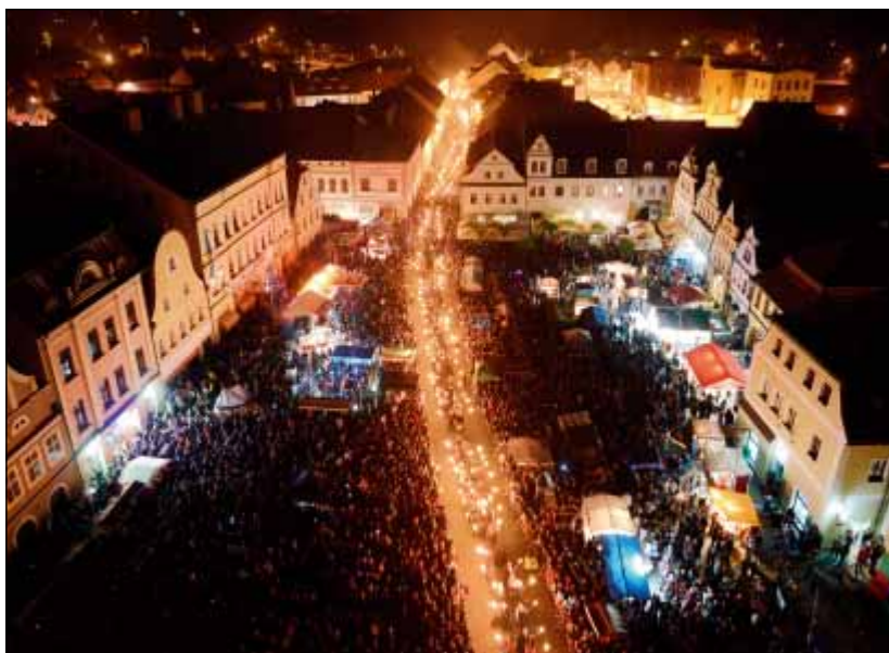
Noční průvod pořádaný při Valdštejnských slavnostech