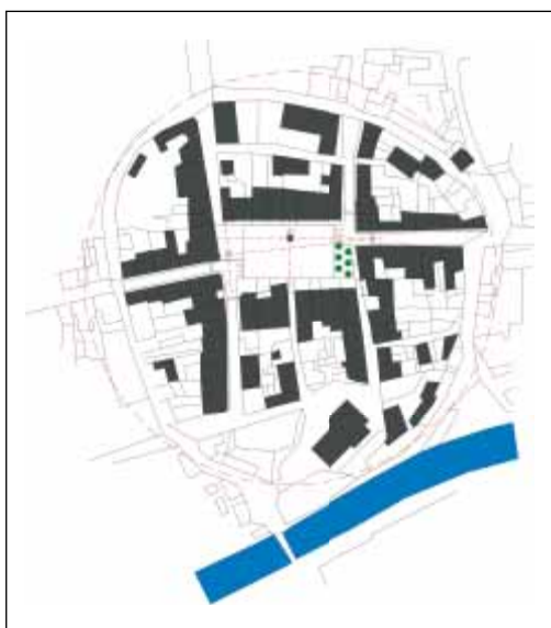
Střed města s vyznačením průhledových os a nedochovaných hradeb