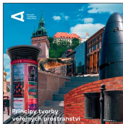
[Tisková zpráva KAM on-line, https://kambrno.cz/ , 14. 10. 2019; dostupné z: www.kambrno.cz/principy ]