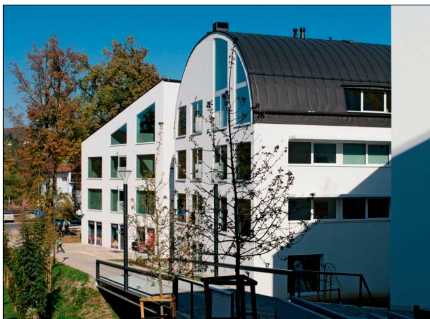
Corso Pod Lipami