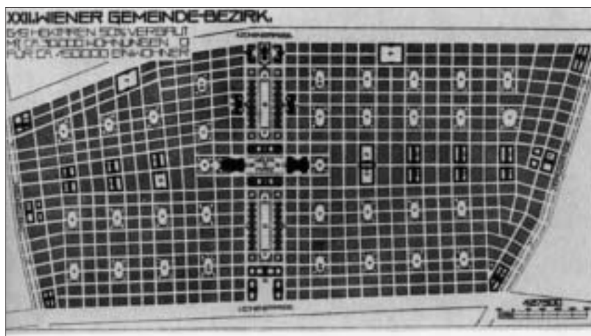
Otto Wagner: modulový městský okrsek, 1911

jedno z předních architektonických škol ve světě. Byl učitelem mnoha českých architektů, z nichž jmenujme především Jana Kotěru, Antonína Engla nebo Františka Roita a jistě rovněž jeho nejnadanějšího žáka Josipa Plečnika.