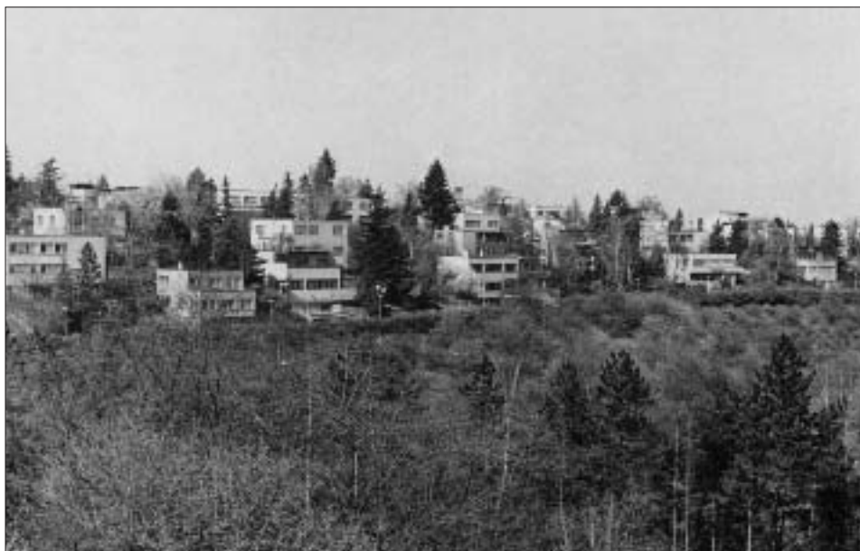
Pavel Janák: sídliště Baba v Praze-Dejvicích, 1928 – 1940

Současníkem Ernsta Maye byl v naší zemi Pavel Janák (12. 3. 1882 – 1. 8. 1956). Studoval u Zítka a Schulze a pak na vídeňské Akademii výtvarných umění u Wagnera. Byl všestranným architektem, zakládal roku 1911 Skupinu umělců výtvarných, byl čle-