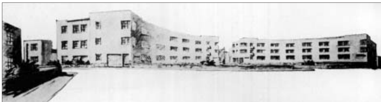
Jindřich Kumpošt: Vaňkovo náměstí, 1926, perspektiva, Žlutý kopec, Brno