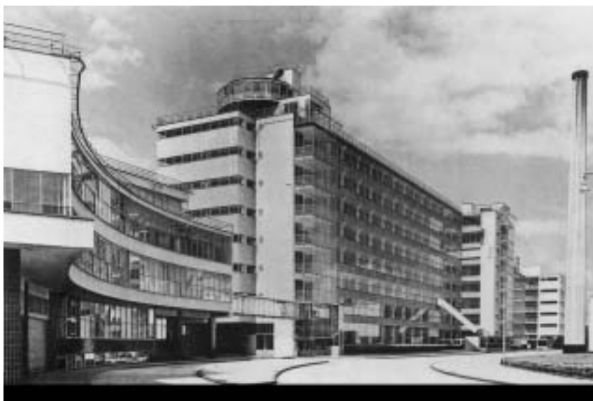
Johannes Andreas Brinkman, Leendert Cornelius van der Vlugt a Mart Stam: továrna Van Nelle v Rotterdamu (1926–1930)

Jedním z nejznámějších příslušníků meziválečné evropské avantgardy byl Mart Stam (5.8.1899 – 15.2.1986). Pocházel z Nizozemí, ale účastnil se aktivně projektových prací v mnoha evropských zemích, zejména v Německu. Byl aktiv-