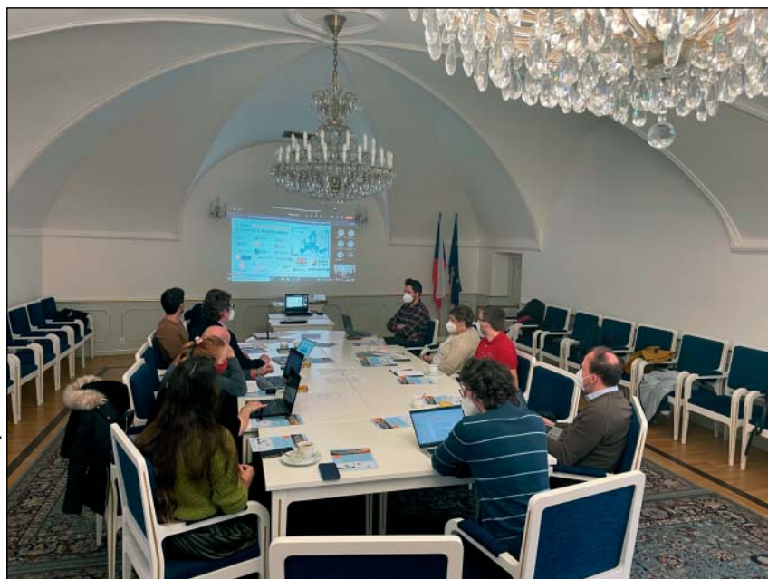
Účastníci národního semináře ESPON METRO

oblastí ve smyslu naplňování národních a evropských rozvojových priorit, stejně jako význam nástroje ITI pro další rozvoj území. Budoucnost metropolitních oblastí přitom hodnotil jako nejistou, a to z důvodu jejich závislosti na politice soudržnosti a nástrojích ITI, neexistence právního rámce pro metropolitní správu a také kvůli přístupu vlády, který nereflektuje metropolitní oblasti jako klíčová území pro veřejné politiky, což je staví do velmi křehké a dočasné pozice. V tomto kontextu přichází projekt ESPON METRO s konkrétními doporučeními, jak tuto situaci změnit.