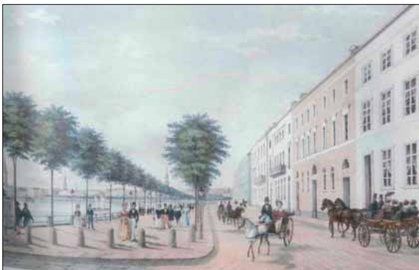
Obr. 3: Kolorovaná litografie Petera Suhra z let 1830–1840 zachycuje novou říční esplanádu v Hamburku, na které našla uplatnění i stromová alej – zelený pás je přiřazen více k řece než k městu

V posledním období (po roce 1945), které je charakteristické ztrátou klasickeho blokoveho řazení zástavby a s ním i přísných kompozičních zásad městské zeleně, se setkáváme s vnášením těchto principů i do historických měst (samozřejmě tím nejsou myšlena města zahradní), především na náměstí a do nejméně frekventovaných ulic. Tyto plochy určené pro obchodní, společenský, politický a kulturní život města v nesvobodném prostředí ztrácejí smysl, stávají se mrtvými a tuto disproporci se snaží novodobí urbanisté uměle zakrýt především „nepolitickou“ zelení, která buď pokrývá plochy, které ztratily svou společenskou funkci, nebo milosrdně zakrývá proluky či novostavby, které se svým prostředím neladí.