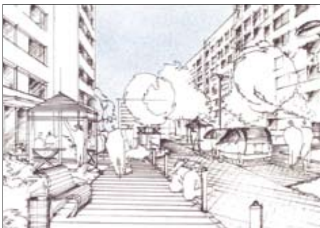
Havířov – regenerace panelového sídliště Šumbark, II. etapa, část projektové dokumentace (A)

kteří auto nemají. Důsledkem je zabírání další půdy a ztráta přírodního prostředí ovlivňující žádoucí biodiverzitu.