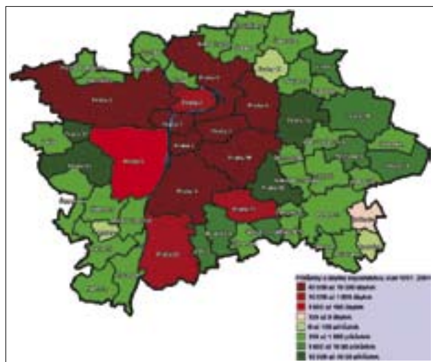
Přesun obyvatel Prahy z jádra města na předměstí v období 1991–2004 (E)

Nástroje, kterými vládne územní plánování a urbanisté, však můžeme použít jen v rozsahu jejich možností. S čistým svědomím nemůžeme slíbit, že urbanismus vyléčí existující lokální vyloučení etnických, sociálních nebo věkových skupin. Že zabrání rostoucí městské kriminalitě, nebo obecně ekonomické polarizaci společnosti. Může však pomoci najít řešení obnovy zpustlých a deprimovaných městských zón a center. Může vyjít vstříc Lisabonskému protokolu a navrhnout využití kapacit a potenciálu území ve prospěch hospodářského růstu. Budoucnost města je často vystavena silným vnějším tlakům, mezi něž patří zejména důsledky rozšiřování Evropského společenství.