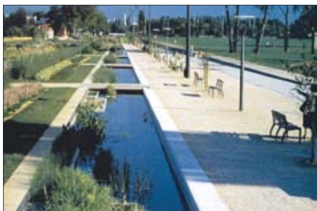
Lyon – přeměna brownfields na městský park (D)

Evropa je charakteristická polycentrickou strukturou velkých, středních a malých měst. Mnoho z těchto měst vytváří clustery v podobě metropolitních oblastí, ale mnohá existují jako samostatná městská centra regionu. Snaha o hospodářský růst a pracovní příležitosti v kontextu celosvětové konkurence vyžaduje vycházet ze zdrojů měst-