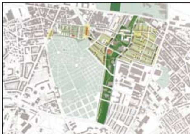
Regenerace části města Lille – projekt regenerace (C)