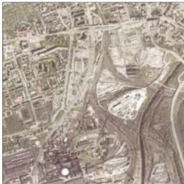
Rozšíření centra města Ostravy – projekt revitalizace brownfields Karolína (B)