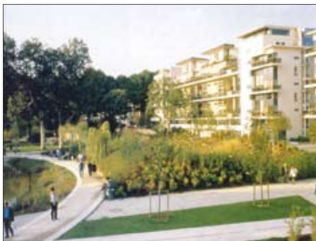
Paříž – bydlení „v parku“ – citlivá symbióza nových bytových domů a parku, důraz na kvalitu prostředí (D)