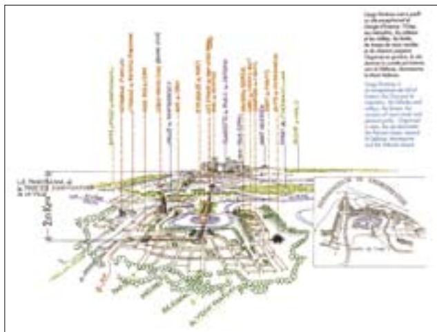
Urbanistická koncepce předměstí Paříže (D)

Nutná je polycentrická reorganizace a transformace městských center. Je nutné zrušit princip jednostranné funkce a upravit funkční dělbou parcel. Údržbu, výstavbu a restaurování ve městě je třeba provádět tradičními technikami.