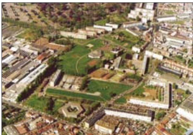
Regenerace části města Lille – letecký snímek výchozího stavu (C)