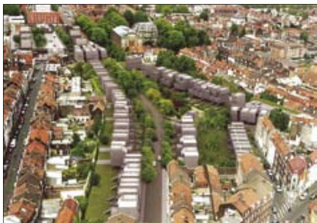
Lille – nová bytová výstavba uvnitř města respektující okolní zástavbu (C)