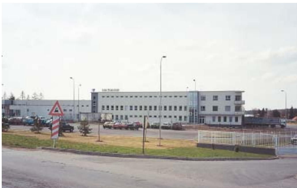
Bystřice nad Pernštejnem: část nové průmyslové zóny

Z výše uvedených kategorií vyplývají i hlavní bariéry zajištění prosperity malých měst. Lze-li považovat lidský faktor za nejdůležitější, je pravděpodobné, že nejzávažnější bariéry najdeme právě v lidech. Není náhodou, že poměrně spolehlivým indikátorem budoucího vývoje města je stupeň rozvoje spolkové činnosti. Hlavní bariérou bývá nedostatek motivace, znalostí, schopností, zkušeností a možností přinést prospěch pro své město, ať už přímo jako podnikatel na správě města nebo nepřímou jako úspěšný podnikatel a plátec daní. Příčinami bývá nepříznivá vzdělanostní struktura, převažující zaměstnanecká psychologie s minimem konstruktivních aktivit, špatné sociální prostředí například jako důsledek imigračního charakteru města nebo i subjektivní faktory, například politické problémy při správě města nebo neúspěšná privatizace hlavních podniků. Negativně se na lidském faktoru mohou projevat i eko-