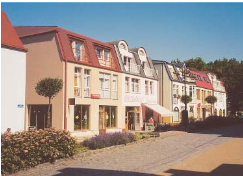
Bystřice pod Hostýnem: nová obchodní ulice v centru města

Předpoklady, které mají jednotlivá malá města pro svou budoucí prosperitu, lze seskupit do následujících katego-