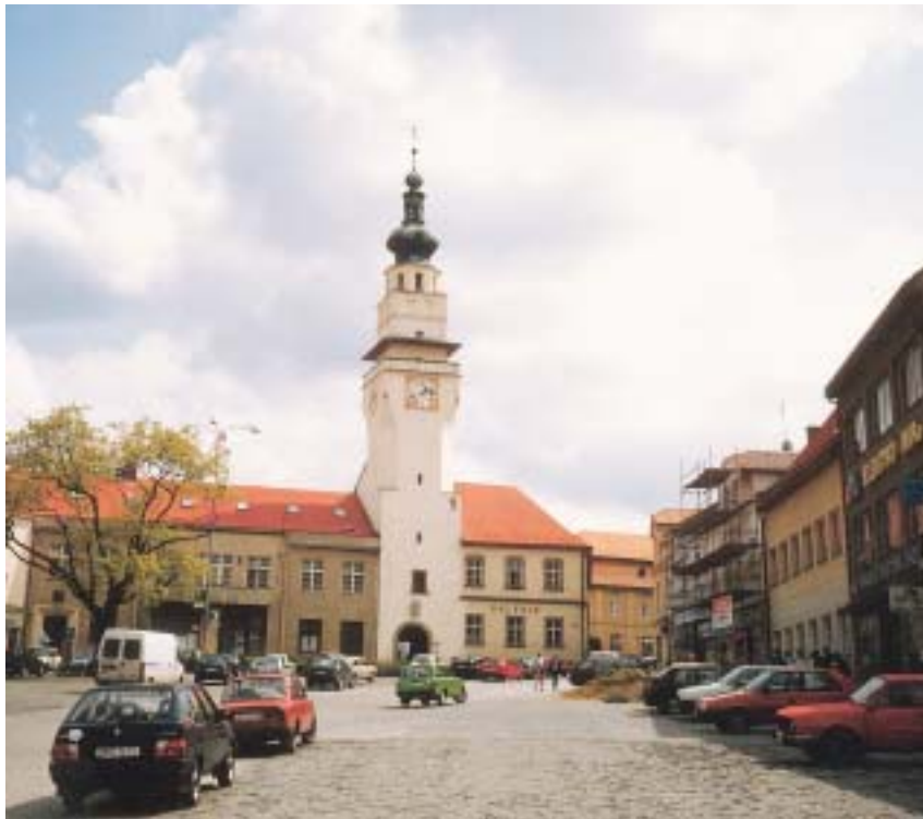
Boskovice: horní částí náměstí dominuje radnice

litativním (high-value) výrobním systémům přispěl k vytváření nových geografických struktur lidského kapitálu. Projevy tohoto kapitálu jsou znalosti, zkušenosti a inteligence (Clarke-Gaile 1998). I když lidským kapitálem disponují především velká města, střediska vysokého školství, vědy a kultury, hraje lidský kapitál v tomto novém pojetí velmi významnou úlohu i při diferenciaci malých měst.