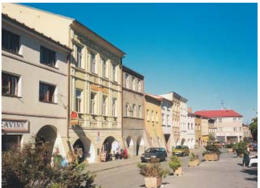
Brušperk: historické centrum města

Cílem tohoto příspěvku je poukázat na některé obecné závěry, které se vynořily při zpracování měst první série, ve vztahu k perspektivám jednotlivých měst a jejich percepci ze strany rozhodujících subjektů.