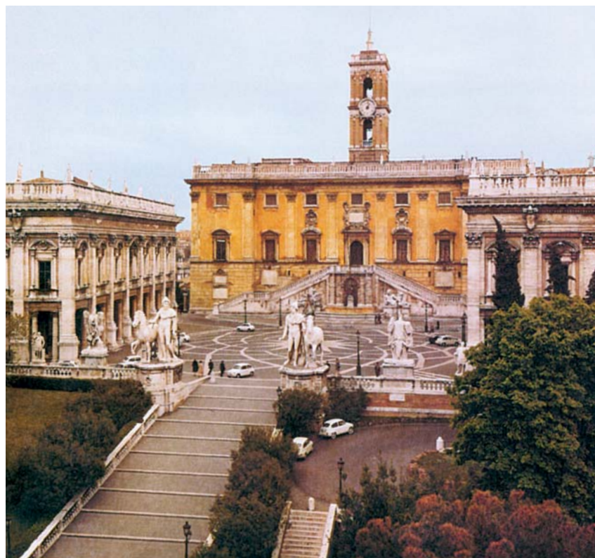
Michelangelo Buonarroti - úprava Kapitolského vrchu v Římě

Byla to ovšem centrální dispozice, která přestala být považována po tridentském koncilu za přijatelnou. Po Michelangelově smrti byl proto Carlo Maderno Pavlem V. pověřen dalším pokračováním ve stavbě. Připojil k ní v letech 1607-12 vstupní podélnou loď a dal tak sice chrámu žádoucí půdorys latinského kříže, avšak nesporně oslabil působení Michelangelovy hmotové kompozice. Dnes se na náměstí, vytvořeném Berniniho kolonádou, uplatňuje přede-