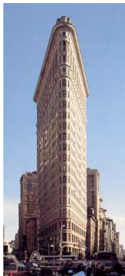
D. H. Burnham: Flatiron House (Dům Žehlička), 1902, New York

Chicagskou výstavou bylo v americké stavbě měst zahájeno hnutí za „ Krásné město “, trvající až do 30. let 20. století a dnes prožívající v USA svou renesanci pod názvem „ nový urbanismus “. Výstava měla takový ohlas, že se Burnham rázem stal módním architektem, který před 1. světovou válkou vlastnil velkou projektovou firmu s 200 zaměstnanci a filiálkami v New Yorku a San Franciscu. Byl zahrnován žádostmi o zpracovávání urbanistických projektů např. pro Cleveland, San Francisco – po jeho zničení zemětřesením po roce 1905, Baltimore a dokonce i pro filipínskou Manilu. Zároveň působil jako poradce pro desítky dalších měst. Již v roce 1894 byl zvolen prezidentem Americ-