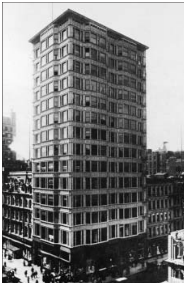
D. H. Burnham & J. W. Roth, Radianc Building, 1890-95, Chicago