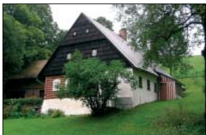
Albeřice – typická chalupa

mí obce je stará vápenná pec z roku 1870, která byla v letech 2003–2011 vyčištěna a zpřístupněna. Na její opravené koruně vznikla zajímavá dřevěná nadstavba určená pro expozici muzea. Tématem muzejní expozice jsou příběhy a osoby propojené s krajinou, výrazné stavby a známé osobnosti. Expozice rovněž odkazuje návštěvníky na další turistické cíle v okolí. Majitelem a investorem muzea je Správa Krkonošského národního parku.