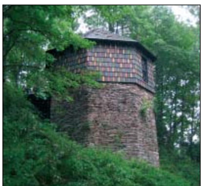
Albeřice – Muzeum Vápenka – exteriér